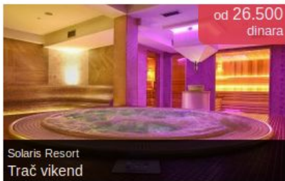
Solaris Resort Trač vikend