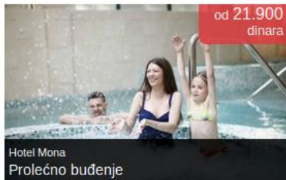
Hotel Mona Prolećno buđenje