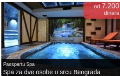
Passpartu Spa Spa za dve osobe u srcu Beograda