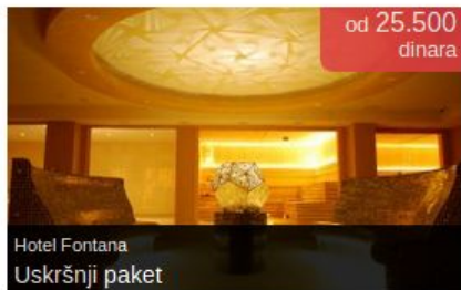
Hotel Fontana Uskršnji paket