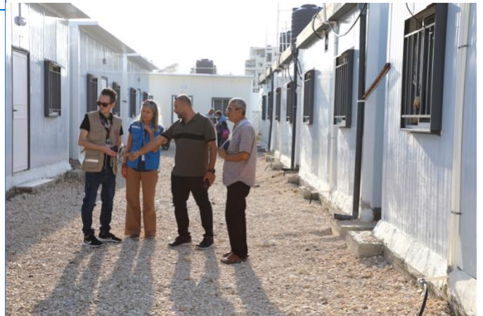
زيارة المفوضية إلى العائلات المتضررة من الزلازل التي تسكن في وحدات مسبقة الصنع في النقعة بمدينة جبلة (محافظة اللاذقية).

يمكن الاطلاع على المزيد من المعلومات عن عمليات المفوضية في الجمهورية العربية السورية، بما في ذلك في شمال غرب سورية على www.unhcr.org