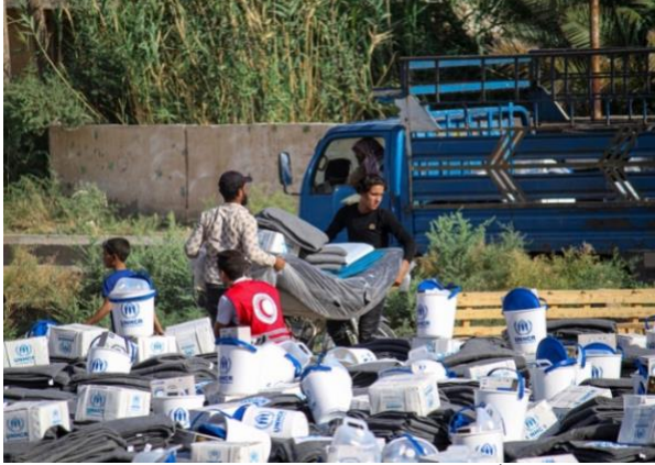
توزيع مواد الإغاثة الأساسية خلال حالة الطوارئ في ريف محافظة دير الزور.

13,500 فرد من الطقس القاسي وتخفف التحديات أثناء النزوح.