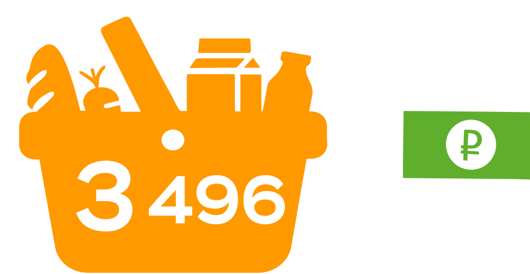
НАБОР «ПЯТЁРОЧКИ» MIN