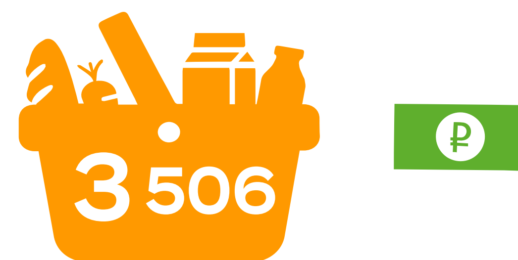
НАБОР «ПЯТЁРОЧКИ» MIN