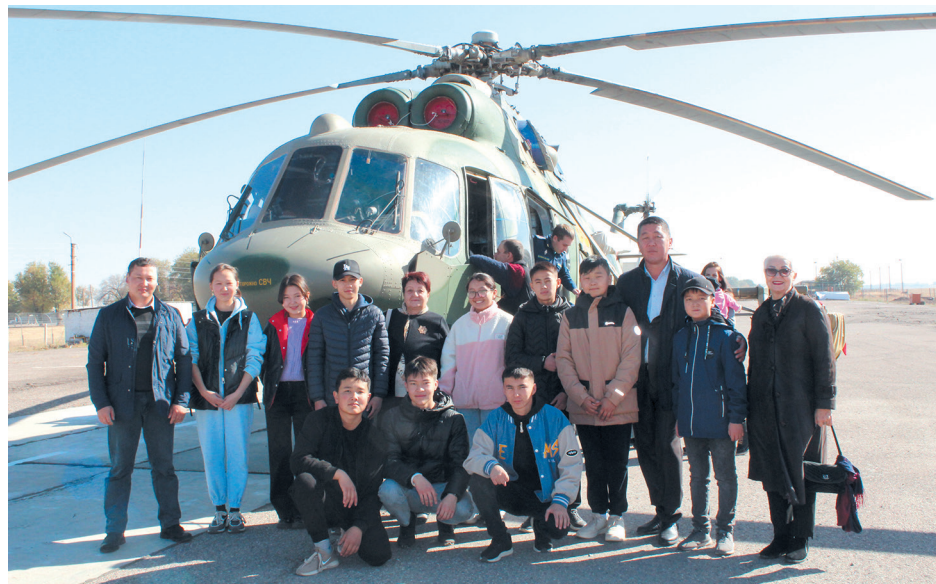
↑ Особый интерес у юных кыргызстанцев вызывают экскурсии по авиабазе.

давать примеру мужественных фронтовиков и героев труда, желание стать достойными гражданами страны. Особый интерес у юных кыргызстанцев, как правило, вызывают экскурсии по территории самой авиабазы, во время которых они могут посетить военный аэродром, увидеть летную технику, побывать в музее боевой славы или гарнизонном храме. Добавляют ребятам впечатлений угощение солдатской кашей и чаепитие со сладостями. Наряду со средними учебными заведениями периодически оказывается поддержка коллективам детского дома семейного типа «Алтын уя» и реабилитационного центра «Умут». Кстати, в преддверии предстоящих