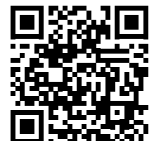
Юбилейный выставочный проект «СТО»