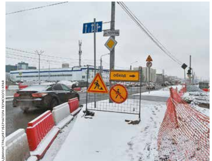
АДМИНИСТРАЦИЯ Губернатора ПЕРМСКОГО КРАЯ

➔ После реконструкции магистралей будут напрямую связаны улицы Крисанова, Пушкина и шоссе Космонавтов.