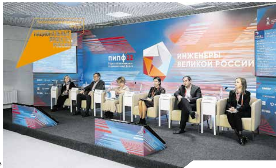
Как отмечают эксперты, в первую очередь стоит обратить внимание на внутренние резервы предприятия.

Чтобы оперативно реагировать на изменения, необходимо формировать лояльность сотрудников. Это позволит удерживать ценные кадры и быть более конкурентоспособной