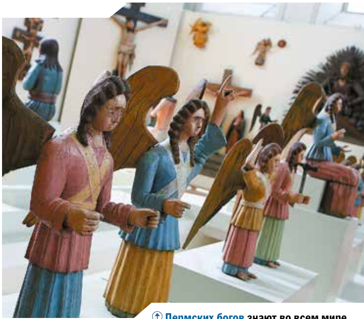
Ⓜ Пермских богов знают во всем мире, а во Франции они в разные годы выставлялись в Лувре и Лионе.

7 ноября 1922 года в Перми открылся художественный музей, где экспонировались картины известных русских художников Николая Гущина, Василия Верещагина, братьев Сведомских и других. Эту дату и принято считать временем основания Пермской художественной галереи, ставшей одним из центров культурной жизни России.