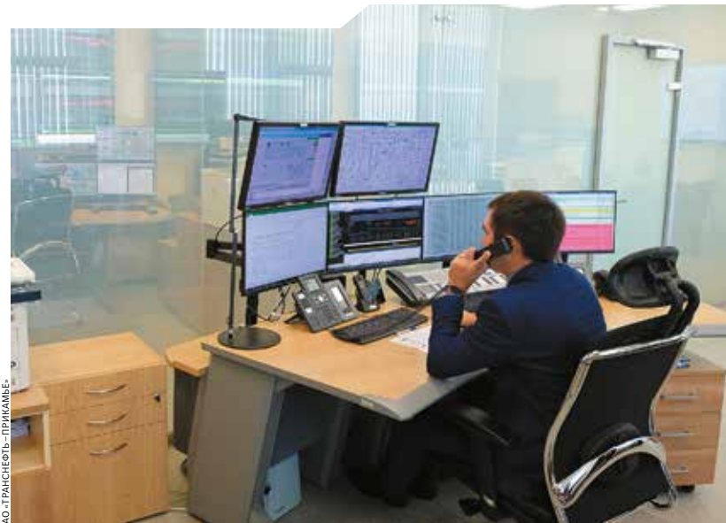
Ⓢ Сердце круглосуточного производства — диспетчерское управление предприятия, где процесс транспортировки контролируется с помощью Единой системы диспетчерского управления.

ЕСДУ — результат интеграции нескольких систем: централизованной системы противоаварийной автоматики, автоматизированной системы контроля «Гидроуклон», систем обнаружения утечек и систем поддержки принятия решений. Предыдущая система позволяла видеть и управлять. ЕСДУ позволяет управлять и помогает диспетчеру: если задвижка закроется, переведет трубопровод в безопасное состояние, при срабатке датчиков давления на двух точках остановит перекачку. Интеллект системы позволяет делать это без команды диспетчера.