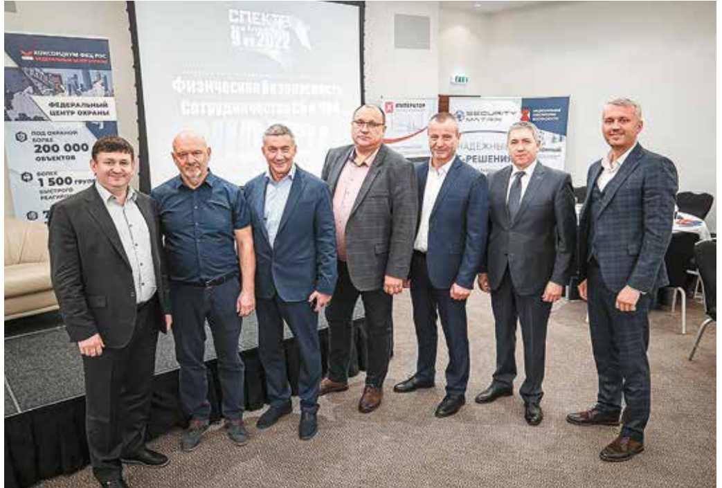
РЕКЛАМА ООО «ЦЕРБЕР»

Власти ссылаются на Бюджетный кодекс РФ и нехватку средств. И в результате все получается, как в поговорке: «Кто-то делает вид, что платит, а кто-то делает вид, что работает».