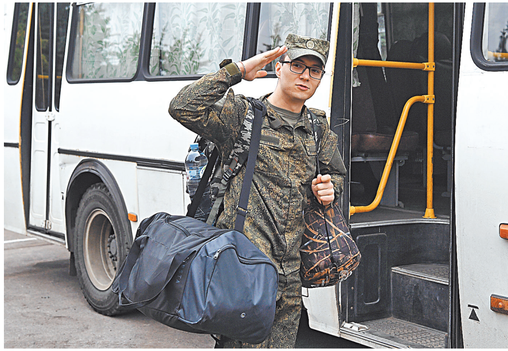
Пока военнослужащий отдает долг Родине, его задолженности банкам замораживаются.

В Томской области решено оказать матпомощь в размере до 42 тысяч рублей семьям мобилизованных, оказавшимся в трудной жизненной ситуации.