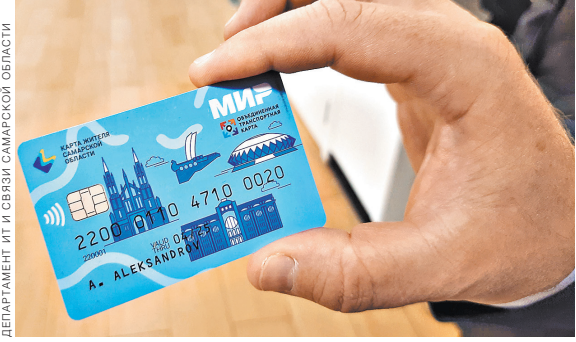
Карта жителя Самарской области действует одновременно и как дебетовая, и как скидочная.

Держатели карты жителя от ВТБ могут стать участниками бесплатной программы лояльности от банка, копить мультибонусы и обменять их на товары в каталоге программы или конвертировать в рубль. А зарплатные клиенты банка могут рассчитывать на сниженные ставки по кредитам и минимальный