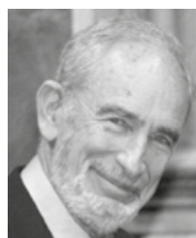
2009 Paul R. Ehrlich