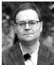
2021 Jordi Bascompte