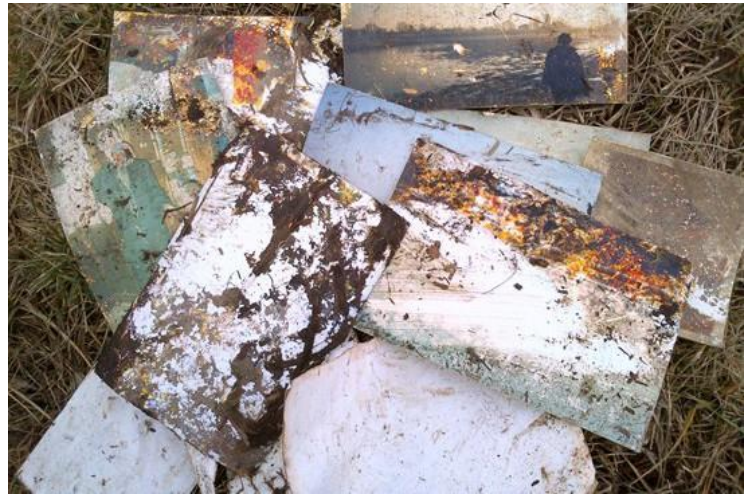
Kouvri nan labou, foto fanmi yo ak lòt héritage fanmilial, foto ki kouche sou lari ak gazon apre gwo inondasyon nan Des Plaines, Illinois, nan mwa avril 2013.

Ak anpil atansyon retire foto mouye nan plastik / papye kadriyaj; li ka pi an sekirite pou déchirel sou kote lwen foto a pase rale foto a tèt li. Sere oswa kopye non ekri, elatriye foto mouye ak negatif ke yo kole ansanm pa janm dwe rale apa. Tranpe yo nan dlo pwòp jiskaske yo separe, jiska 48 èdtan jiskaske ou ka li sèk oswa friz yo. (Pa friz negatif vè oswa plak.) Rense yo nan dlo fre. Pa manyen oswa sifas blot. Bay foto yo lè sèk, pa pann yo ak pens yo mete nan bor yo, oswa mete yo plat, Mete yo fas anle, sou papye dezenfekte. Kenbe foto pou pa kontakte sifas adjasan oswa youn ak lòt. Si dèyè vè, gade Ankadreman.