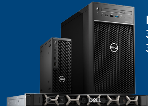
Precision 3930 Rack, 3240 Compact und 3650 Tower