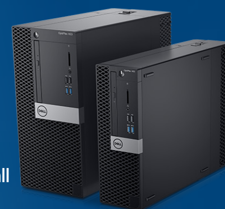
OptiPlex XE3 Tower und Small Form Factor