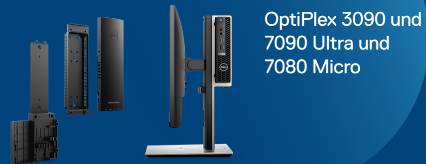
OptiPlex 3090 und 7090 Ultra und 7080 Micro