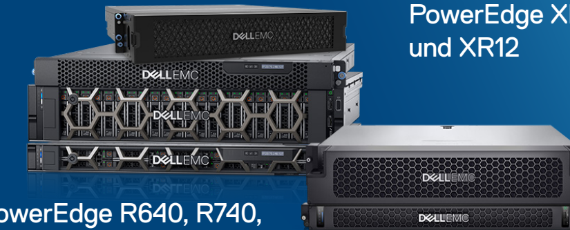
PowerEdge XR11 und XR12