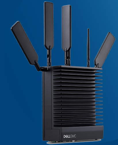
Edge Gateway 5200

Edge-optimierte Rugged-Server für Telekommunikation bis hin zu Schifffahrt