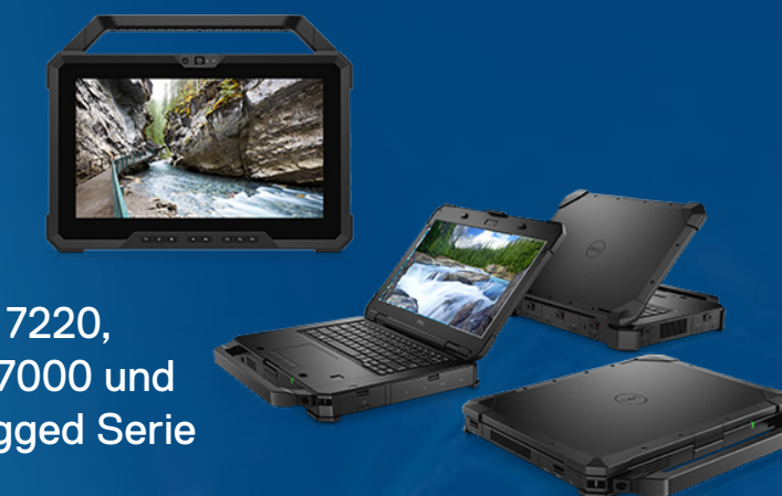
Latitude 7220, Latitude 7000 und 5000 Rugged Serie