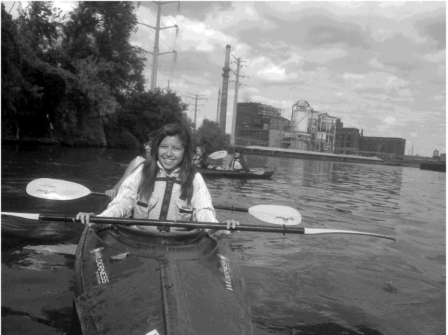
Miembros de LVEJO remaron cerca de la planta Fisk.