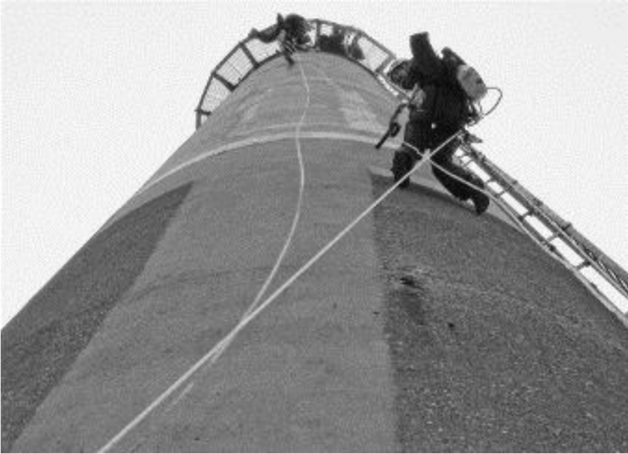
Activistas de Greenpeace escalan la chimenea al Fisk.