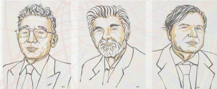
Syukuro Manabe Klaus Hasselmann Giorgio Parisi

Galardonados por sus pioneras contribuciones para nuestro entendimiento de los sistemas físicos complejos