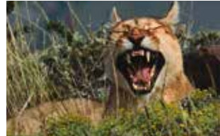
Panteras Andoni Canela

15:30 h. Andoni Canela lleva cuatro años trabajando con los grandes felinos del planeta. Nos presentará su proyecto y podremos ver la película documental Panteras sobre tigres, leones, leopardos, jaguares, panteras de las nieves, lince, leopardos y pumas. (110')