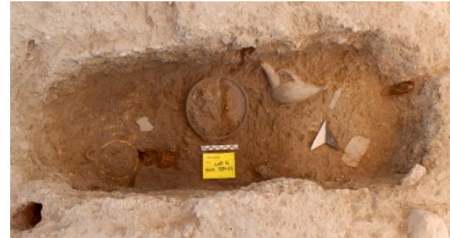
Tomba de la necròpolis de Les Casetes-Jovada