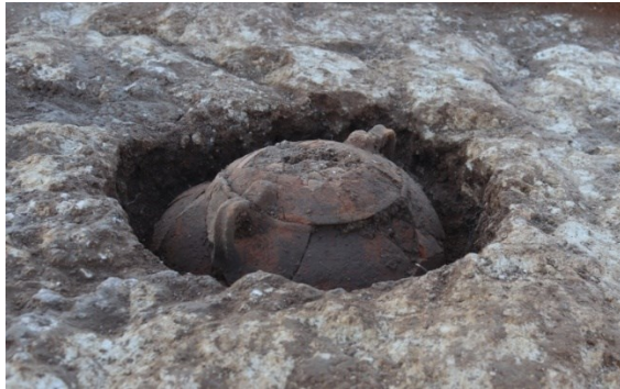
Tomba de la necròpolis de El Pouaig