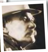
格曾·博格勒姆 (Gutzon Borglum)

大山背后的故事 林肯·博格勒姆博物馆 (Lincoln Borglum Museum) 的展览讲述了那些曾将一座大山变成对伟大国家献礼的人们的故事。几个展览集中介绍林肯·博格勒姆的父亲, 雕塑家格曾·博格勒姆, 他的独创性、雄心和拓荒者精神使梦想变成现实。您还会了解到赋予雕塑家灵感的四位总统的生平介绍。互动式的演示, 400件历史物品和300张照片让您通过视觉, 音响和触觉体验大山的历史。