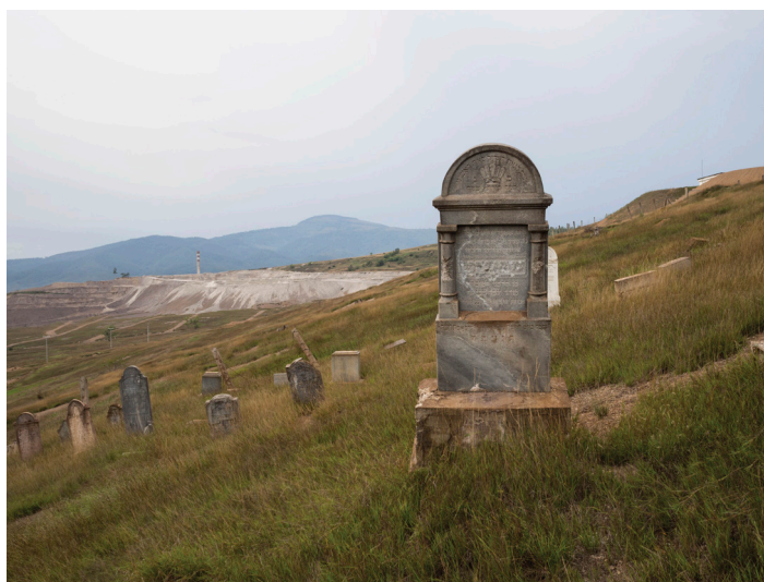
Vítazná snímka 7. slovenského ročníka zobrazujúca Židovský cintorín v Jelšave