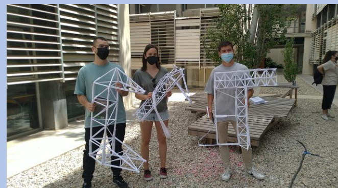
Figura 2. Estructura del 19 concurso.