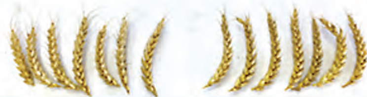
Контроль Схема хозяйства