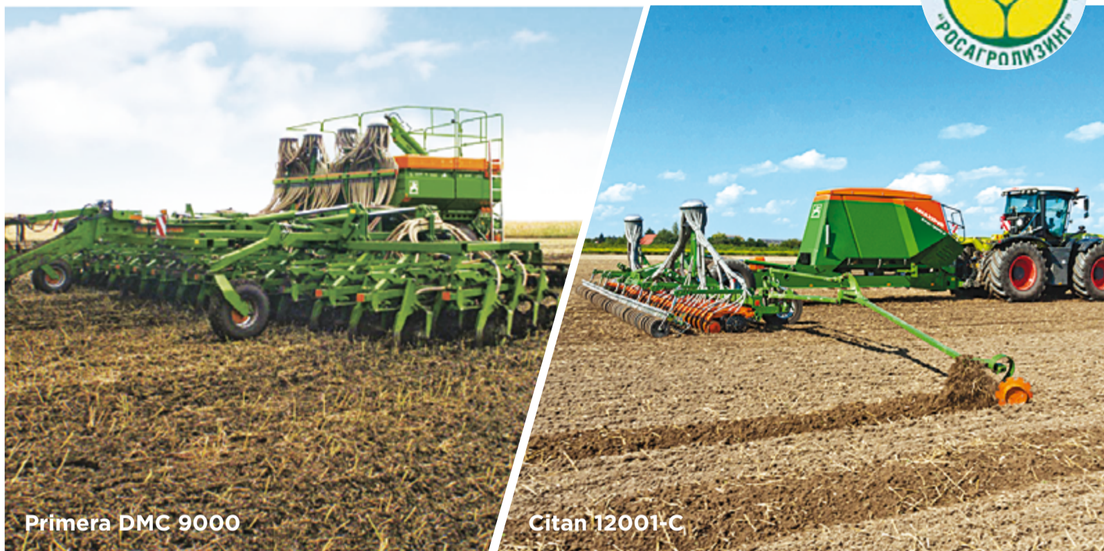
Фермеры выбирают оборудование за надёжность и эффективность.