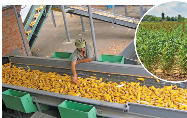
Вся кукуруза проходит строгий контроль качества.

Предприятие на самом деле уникальное. Завод объединил свыше 20 семеноводческих хозяйств края, чья материально-техническая база и культура земледелия позволяют обеспечить высококачественное выращивание семенных участков кукурузы гибридов первого поколения. Высокоинтегрированная система собрала научные селекционные организации, семеноводческие хозяйства и ККЗ в завершённом цикле производства семян куку-