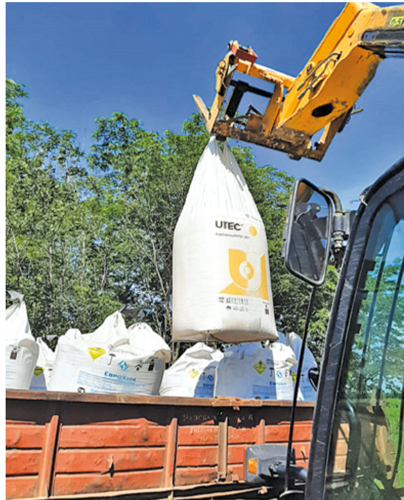
Удобрения «ЕвроХим» обеспечивают высокие урожаи.

В настоящее время проблема дефицита серы в почвах харак-