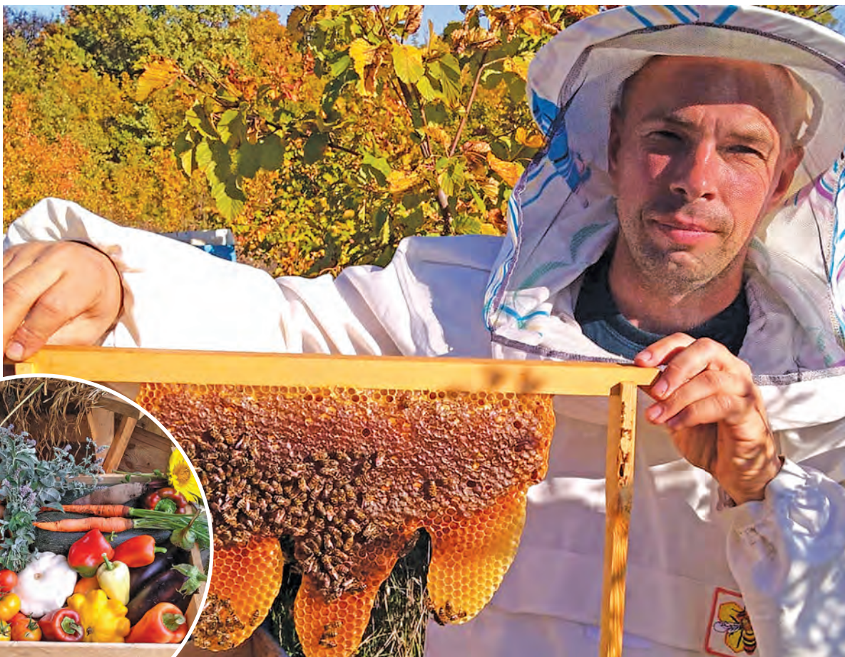
Дело фермера не стоит на месте. Помимо сада, есть пасека и пруд.

Экологически чистые продукты для себя и не только