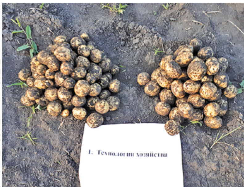
Наибольшую эффективность карбамид UTEC® от «ЕвроХим» показывает в засушливых районах, а также на культурах, отзывчивых к длительному азотному питанию, таких как картофель.

тественного состава сырьевой породы, в удобрении присутствуют такие важные элементы, как сера (1,7%), магний (0,9%) и кальций (0,2-0,5%). Фосфор необходим для закладки генеративных органов и развития корневой системы, калий для формирования здоровых и вкусных плодов, кальций и магний - для повышения товарных качеств и срока хранения. Из наиболее востребованных среди аграриев формул можно выделить NPK 10-26-26 и 16-16-16 - универсальные марки для сельхозкультур; NPK 23-13-8 - для оптимального питания кукурузы и зернобобовых; марка NPK 14-14-23, которая хорошо себя показала на масличных и овощных культурах, картофеле, а также с успехом применяется на ягодных плантациях и в садах. Благодаря преобладанию калия, формула способствует формированию именно плодовой части растений, овощи и фрукты накапливают больше сахаров и лучше сохраняются во время транспортировки и на прилавке.