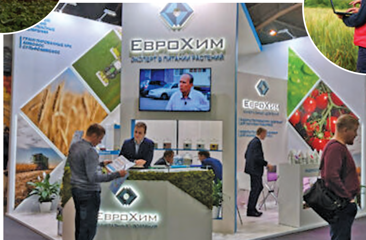
Удобрения соответствуют мировым стандартам качества, их экспортируют в европейские страны. Продукт получается доступнее зарубежных и эффективнее отечественных аналогов.