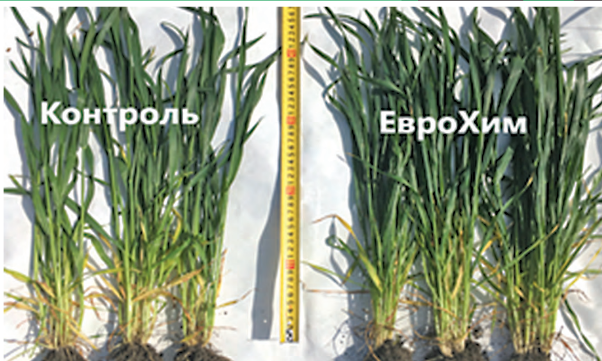
Данные на основании испытаний в хозяйствах

В ФГБУ ОПХ им. Мазлумова Воронежской области оценивали агрономическую и экономическую эффективность программы питания сои сорта «Припять» с применением листовых подкормок препаратами Aqualis для увеличения маслячности и содержания протеина в зерне. На фоне основных почвенных удобрений, применяемых по схеме хозяйства, тестировали листовые подкормки