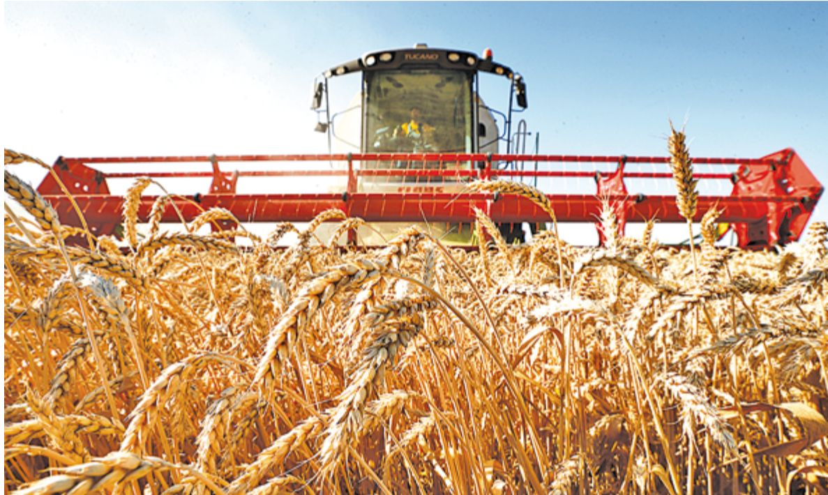
Заморозки после аномально тёплой зимы и засуха весной помешали аграриям повторить успехи прошлого года.

Заморозки после тёплой зимы и засуха могут сказаться не только на растениеводстве, но и урожае винограда и плодов. Хотя если брать ситуацию в виноградной отрасли в глобальной ретроспективе - за последние пять лет, то за эти годы площадь виноградников в регионе увеличилась с 25,3 тыс. га до 26,5 тыс. га, или