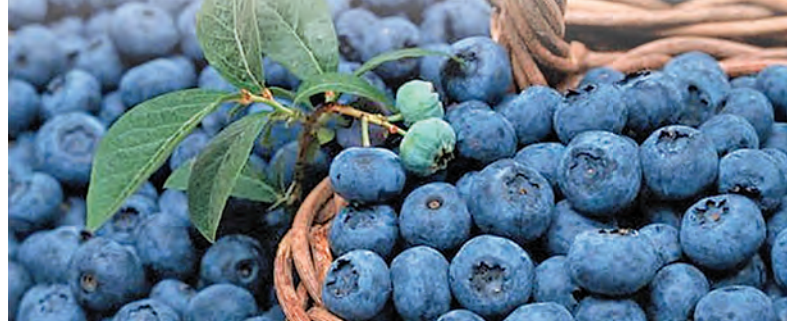
Северную ягоду голубику выращивают на Кубани.

Тем не менее, наращивают объёмы производства и других ягодных культур, в частности, голубики. Крупные фермерские хозяйства есть в Лабинском, Новокубанском районах, а также в Горячем Ключе.