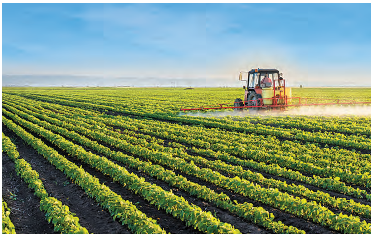
Листовая подкормка дополняет традиционный способ внесения удобрений - почвенный.

Всем этим требованиям отвечают водорастворимые удобрения линейки Aqualis® от компании «ЕвроХим». Aqualis® - это набор марок комплексных удобрений с различным соотношением азота, фосфора, калия, серы и магния, дополнительно обогащённых железом, бором, цинком, медью, марганцем, молибденом. Микроэлементы в составе Aqualis® содержатся в хелатной форме, что позволяет растениям усваивать их максимально быстро и полно. Благодаря исключительно высококачественному сырью и передовой технологии производства данные удобрения обладают 100%