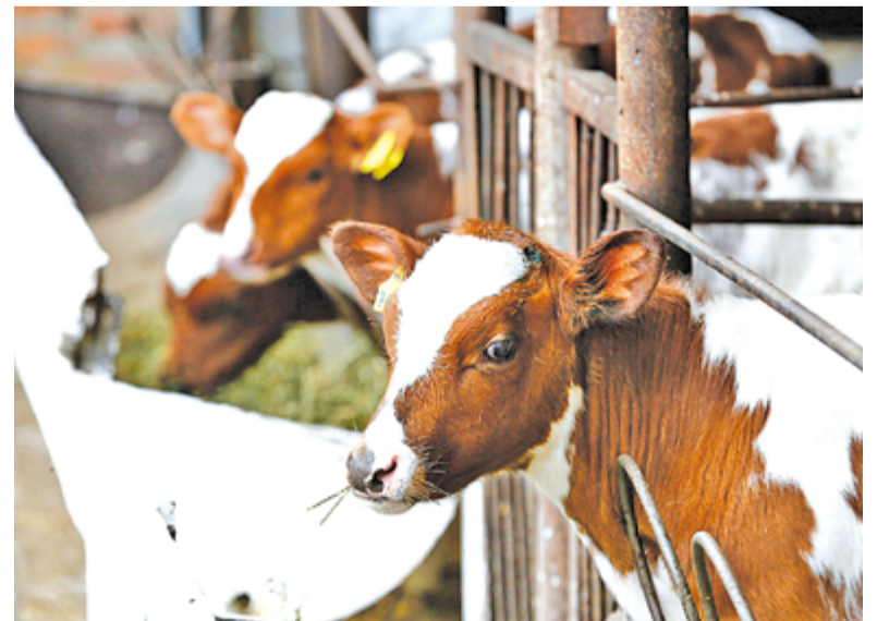
Сейчас край производит почти 1,5 млн тонн молока.