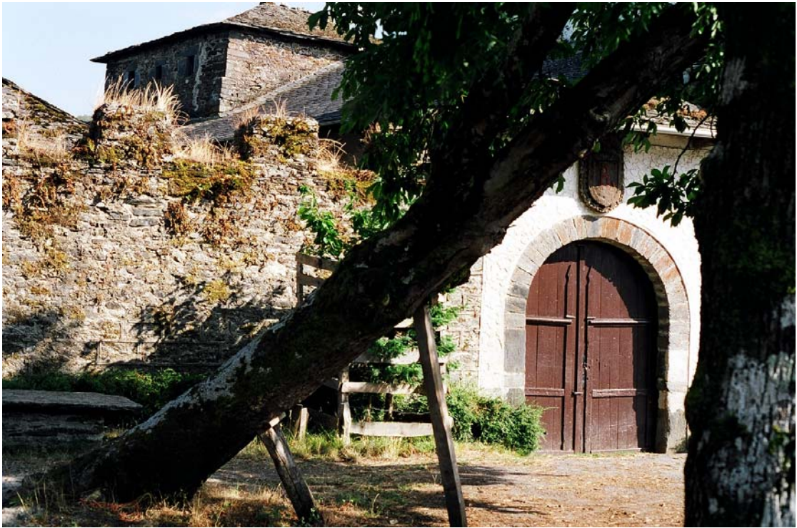
Cecos (Ibias). Palacio

Servicio de Biblioteca Documentación y Archivo