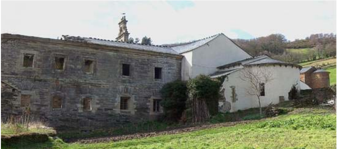
Villanueva de Oscos. Monasterio de Santa María.

Servicio de Biblioteca Documentación y Archivo