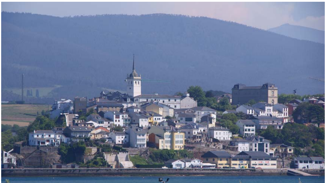
Castropol, vista general