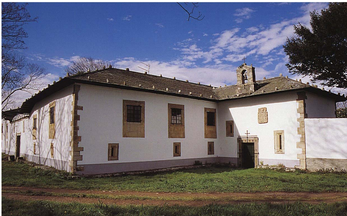
Mohías, Coaña, Palacio de Mohías.

Servicio de Biblioteca Documentación y Archivo