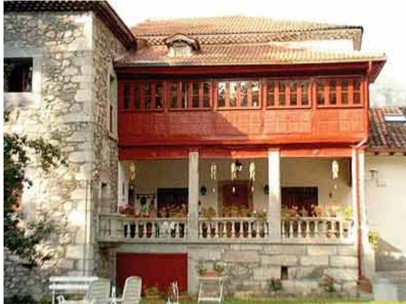
Pola de Somiedo, Palacio de Álvaro Flórez Estrada 1

Servicio de Biblioteca Documentación y Archivo