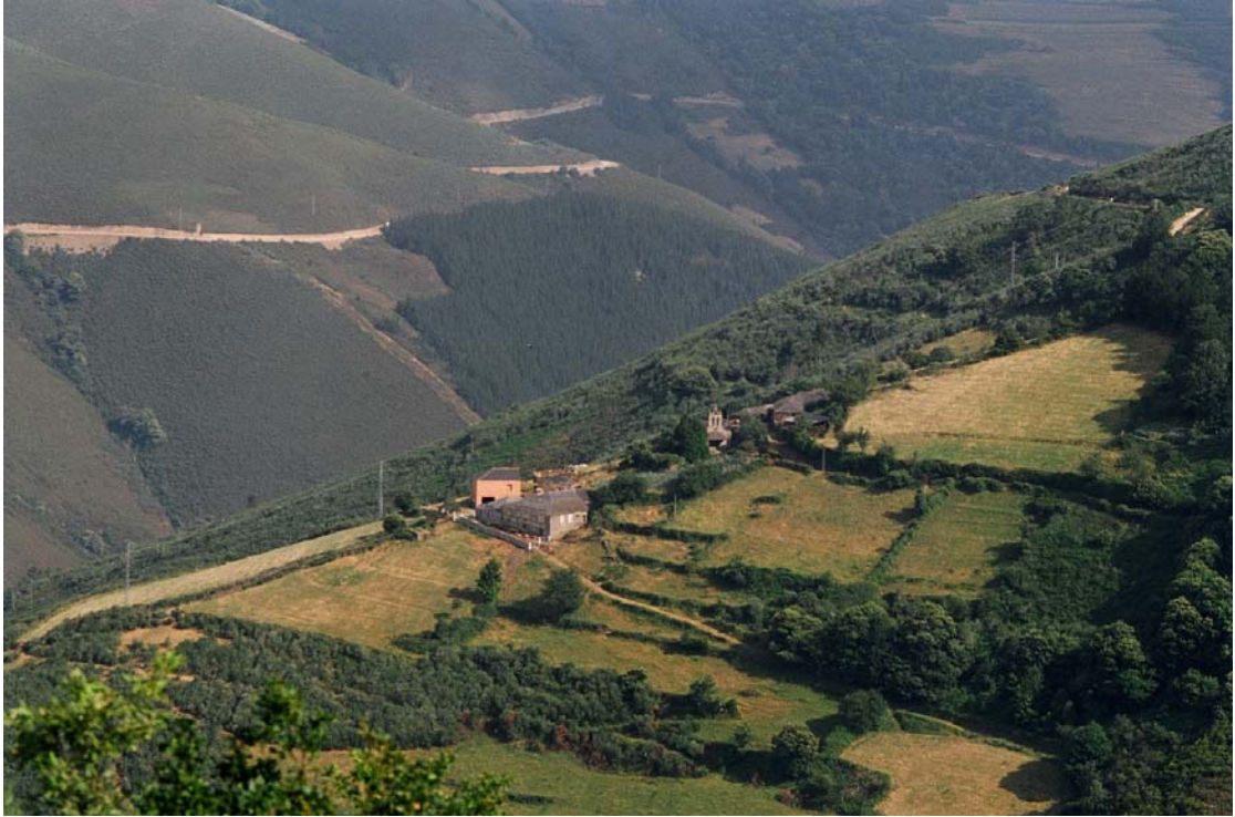
Coto de Sena, Santa Comba de Coutos (Ibias). Vista general del pueblo Foto: Enrique López Fernández, 1994

Servicio de Biblioteca Documentación y Archivo