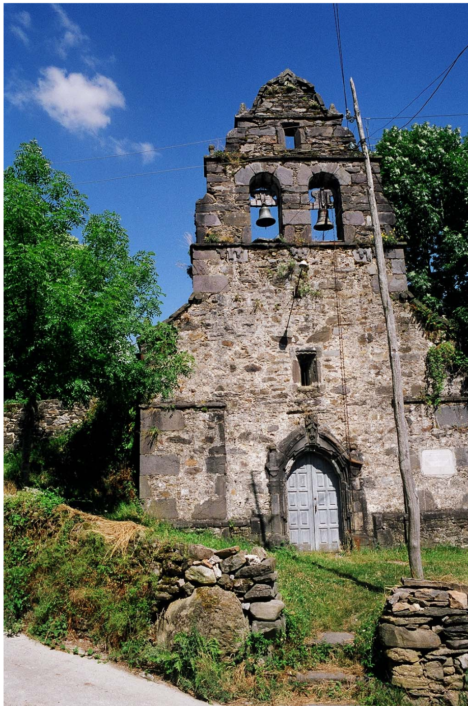
Monasterio de Hermo (Cangas del Narcea). Iglesia. Foto: Enrique López Fernández, 1994

Servicio de Biblioteca Documentación y Archivo