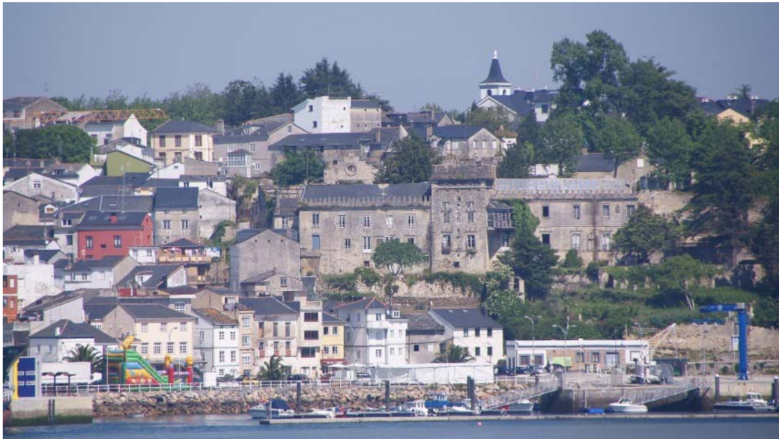
Figueras, Castropol. Vista general

Servicio de Biblioteca Documentación y Archivo