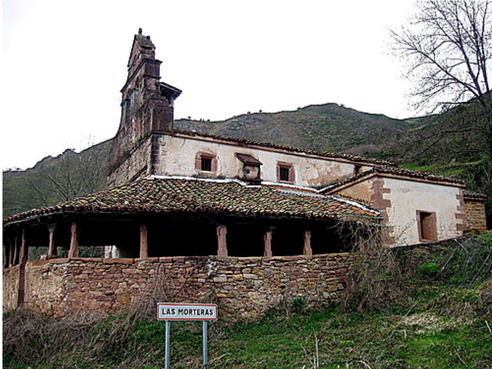
Las Morteras, Somiedo. Iglesia.

Servicio de Biblioteca Documentación y Archivo