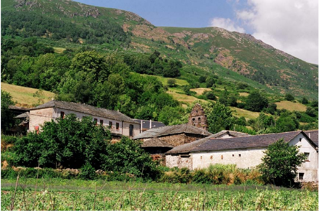
Monasterio de Hermo (Cangas del Narcea). Vista general del pueblo

Servicio de Biblioteca Documentación y Archivo