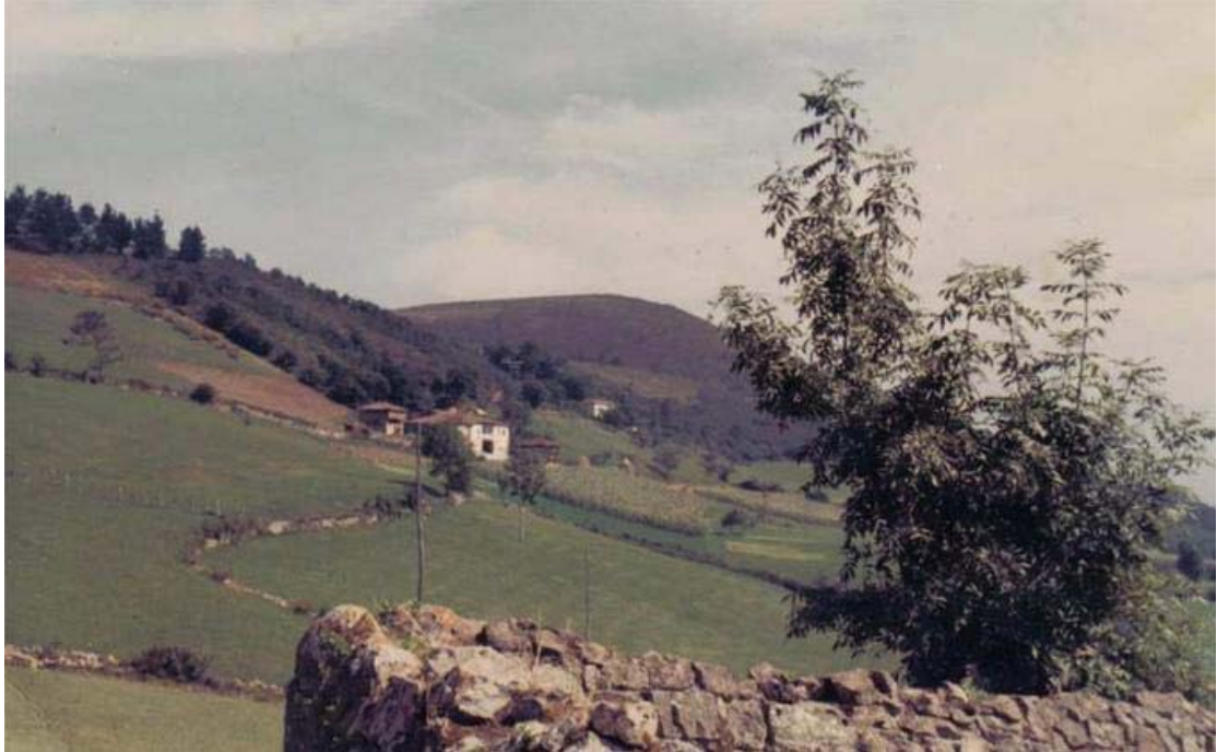
Doriga, Salas, Casa de la Requexada

Servicio de Biblioteca Documentación y Archivo