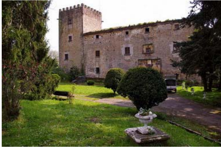
Doriga, Salas, Palacio de Doriga

Servicio de Biblioteca Documentación y Archivo