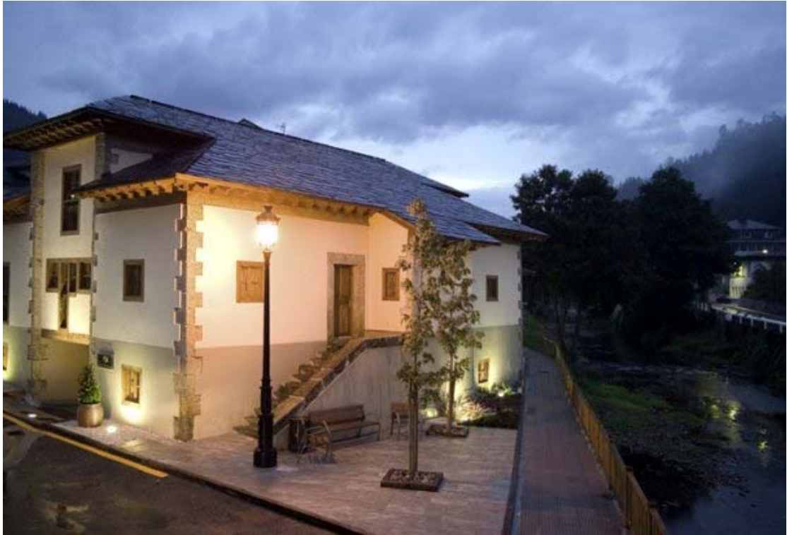
Navelgas, Tineo, Casona Museo del Oro

Servicio de Biblioteca Documentación y Archivo