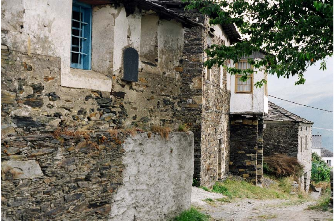
Ouviano, Negueira (Lugo). Casa rectoral. Foto: Enrique López Fernández, 1994

Servicio de Biblioteca Documentación y Archivo