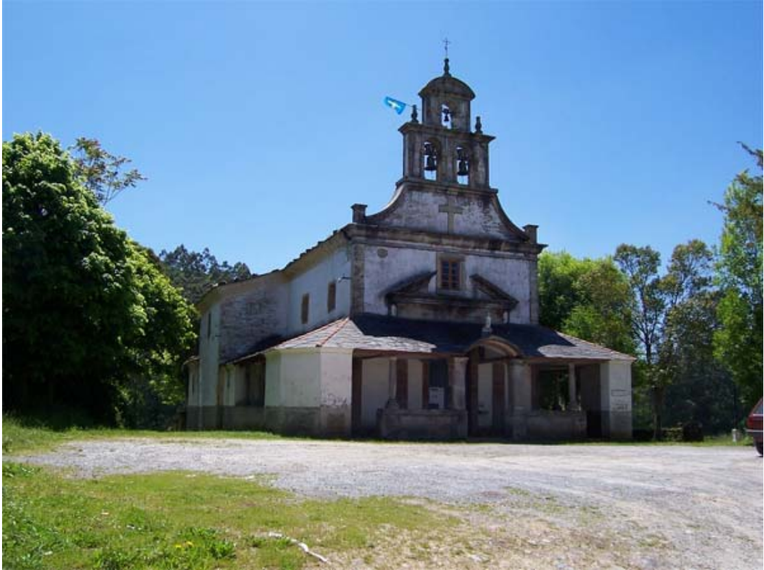
Nuestra Señora de la Braña, El Franco, Iglesia.

Servicio de Biblioteca Documentación y Archivo