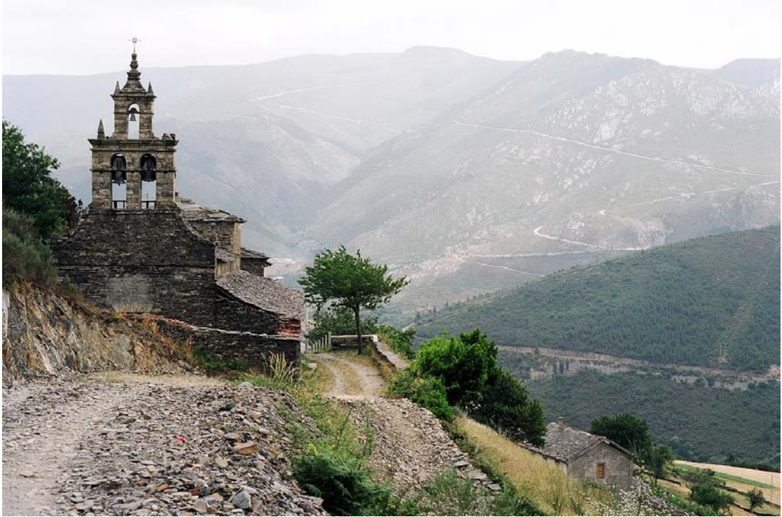
Ouviano, Negueira (Lugo). Iglesia. Foto: Enrique López Fernández, 1994

Servicio de Biblioteca Documentación y Archivo