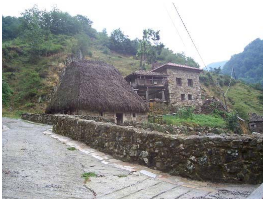
Valle del Lago, Somiedo, sede de Veigas

Servicio de Biblioteca Documentación y Archivo