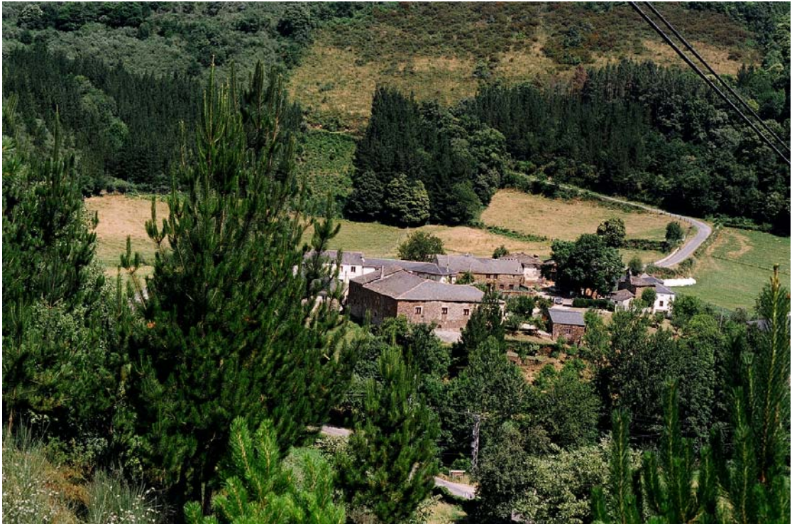
Lamas de Moreira, Fonsagrada (Lugo). Vista general del pueblo

Servicio de Biblioteca Documentación y Archivo