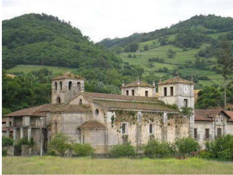
Cornellana, Salas, Monasterio de San Salvador

Servicio de Biblioteca Documentación y Archivo