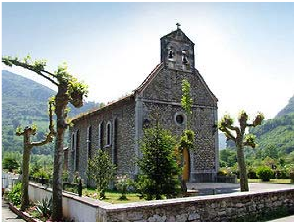
Argame. Morcín. Iglesia.

Servicio de Biblioteca Documentación y Archivo