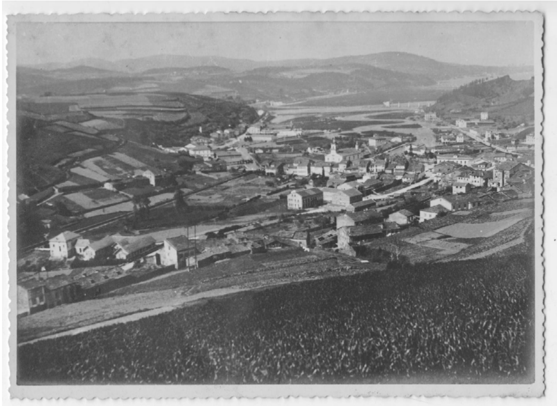
Vegadeo , vista general de la villa en 1950.

Servicio de Biblioteca Documentación y Archivo