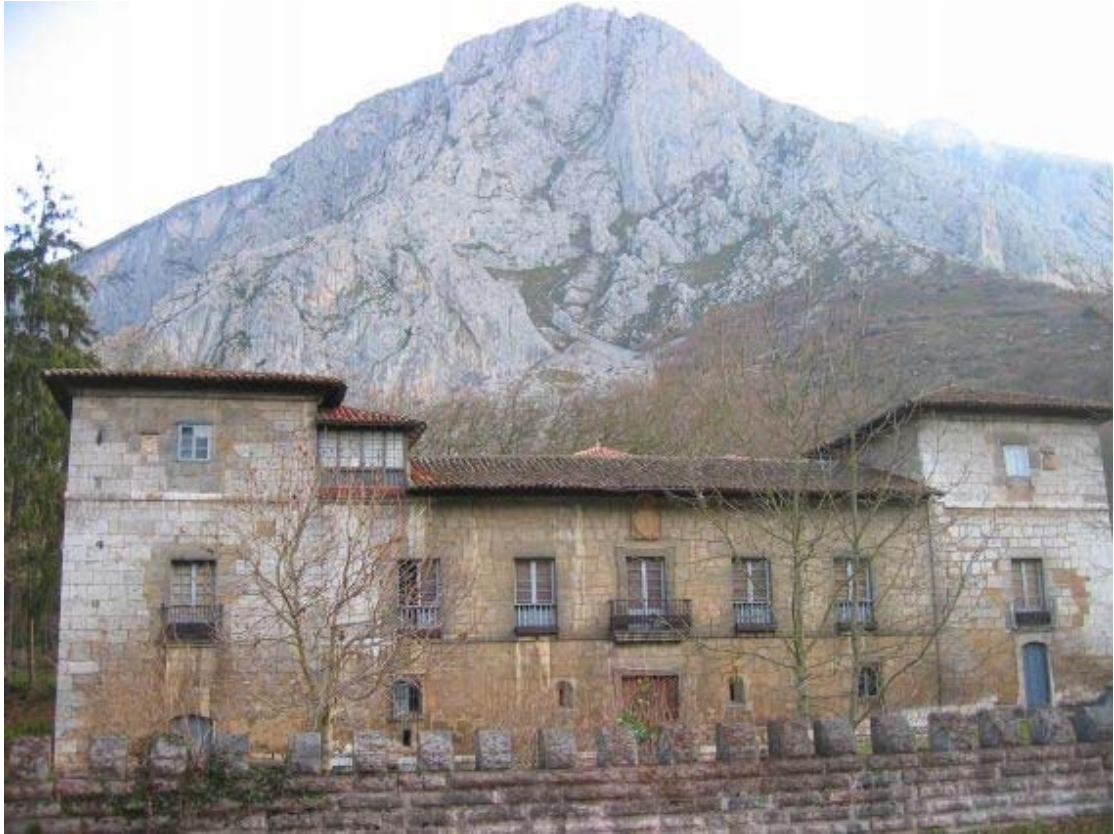
Teverga, Entrago. Palacio de los Condes de Aguera.

Servicio de Biblioteca Documentación y Archivo