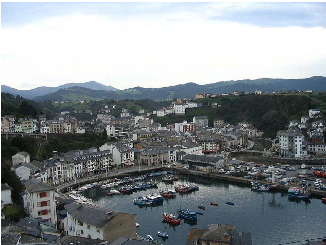
Luarca, vista general

Servicio de Biblioteca Documentación y Archivo