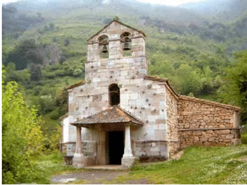
Pola de Somiedo, Iglesia de San Pedro

Servicio de Biblioteca Documentación y Archivo