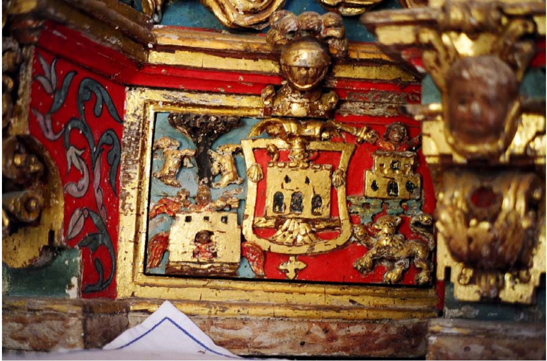
Lamas de Moreira, Fonsagrada (Lugo). Capilla del Palacio, detalle

Servicio de Biblioteca Documentación y Archivo