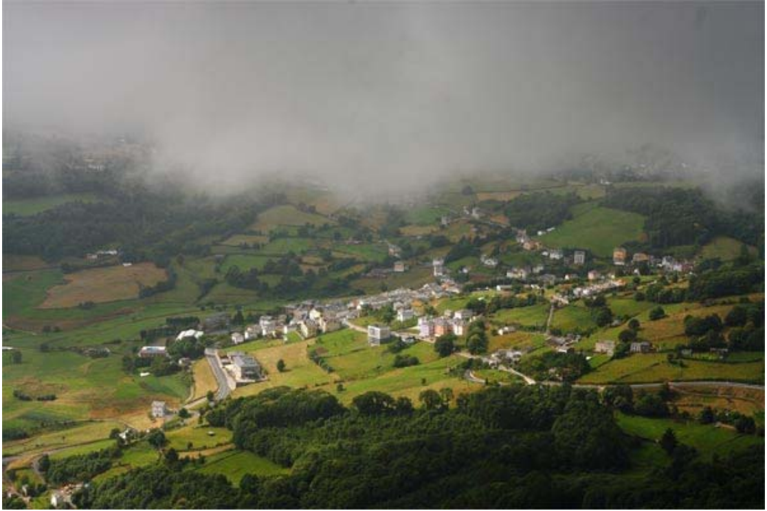
Boal. Vista general del pueblo

Servicio de Biblioteca Documentación y Archivo