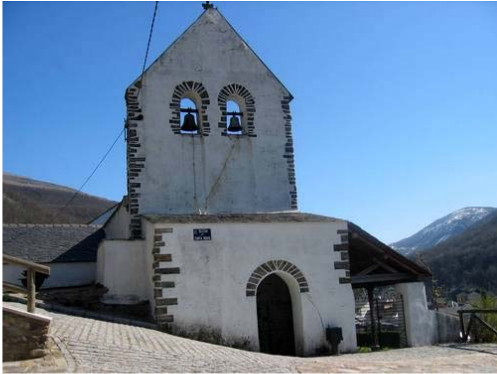
Cerredo, Degaña. Iglesia de Santa María.

Servicio de Biblioteca Documentación y Archivo