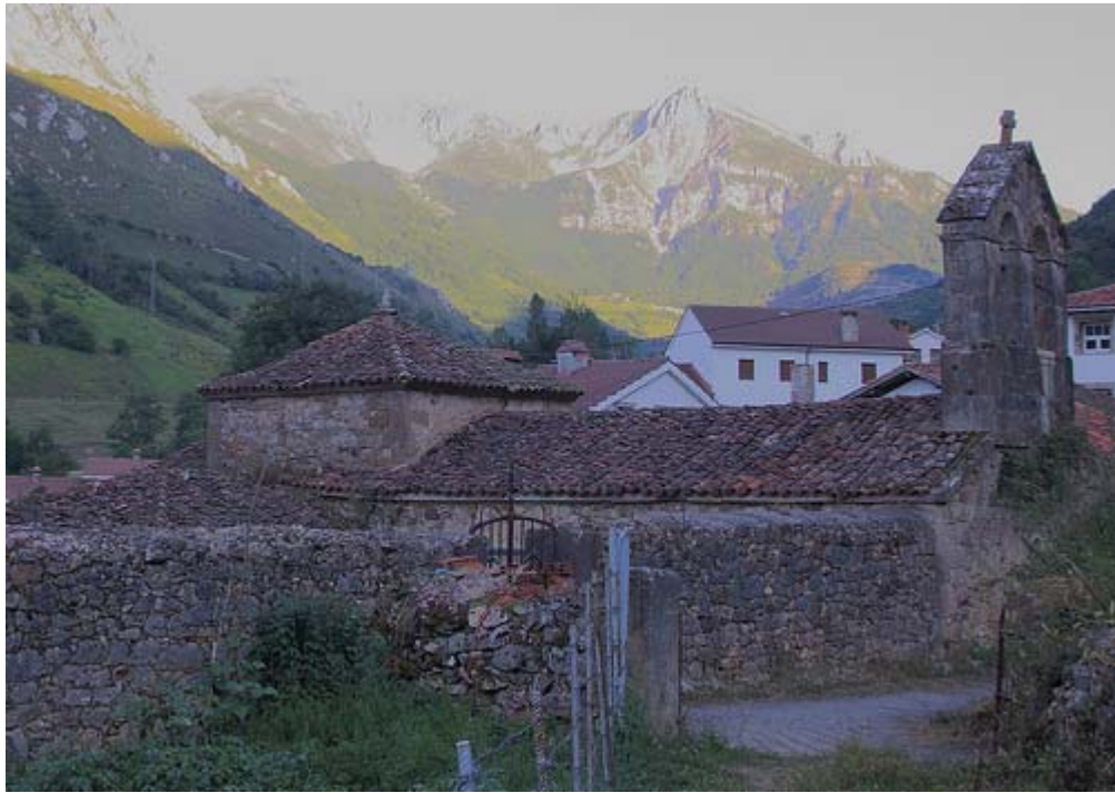
Caunedo, Somiedo. Iglesia.

Servicio de Biblioteca Documentación y Archivo