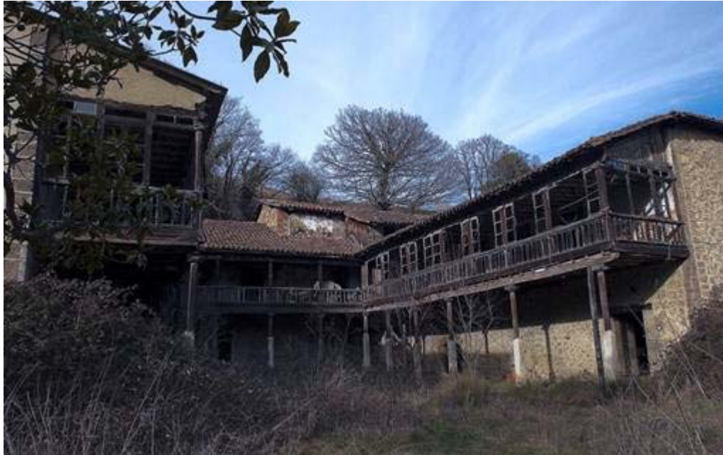
Teverga, San Martín. Palacio de Valdecarzana

Servicio de Biblioteca Documentación y Archivo