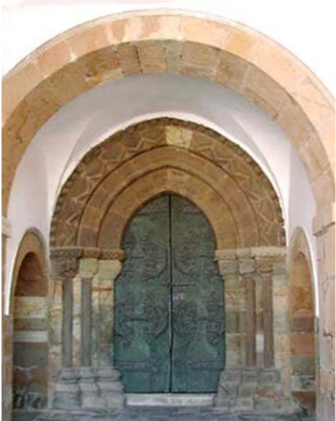
Tineo , Iglesia d e San Pedro.

Servicio de Biblioteca Documentación y Archivo