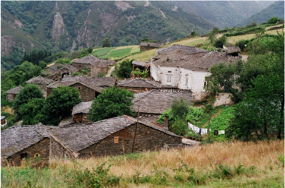
Vitos (Grandas de Salime). Vista general del pueblo Foto: Enrique López Fernández, 1994

Servicio de Biblioteca Documentación y Archivo