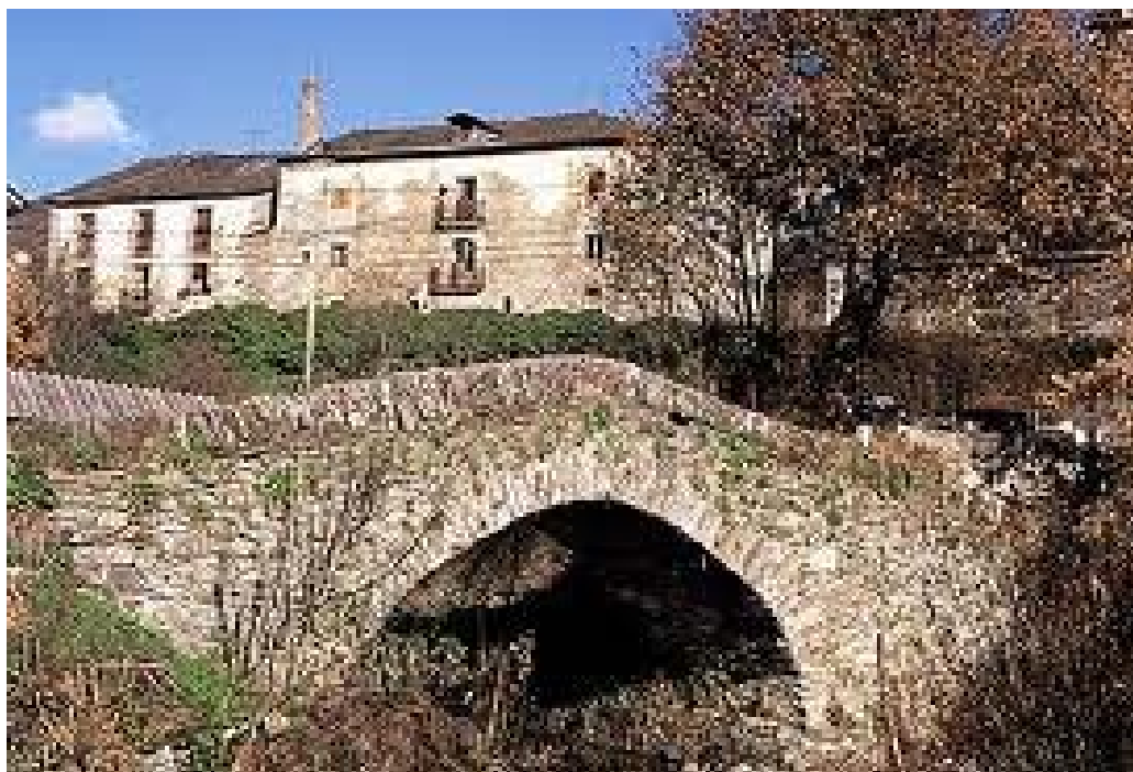
Caballes de Abajo, Villablino (León), Puente Antiguo

Servicio de Biblioteca Documentación y Archivo