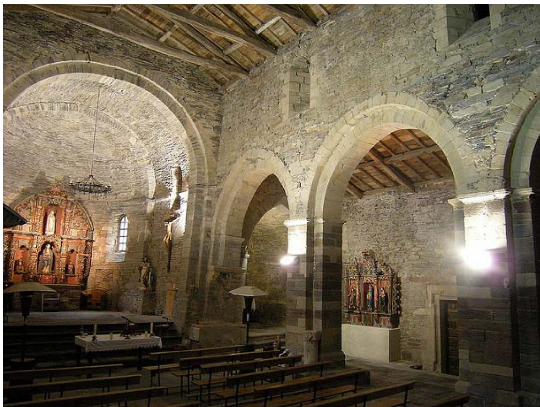
Villanueva de Oscos. Interior de la Iglesia del Monasterio de Santa María.

Servicio de Biblioteca Documentación y Archivo