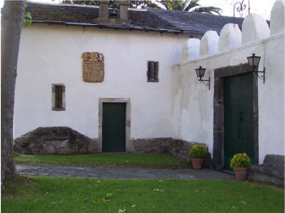
Miudeira (Miudes), El Franco, Palacio de Miudes.

Servicio de Biblioteca Documentación y Archivo