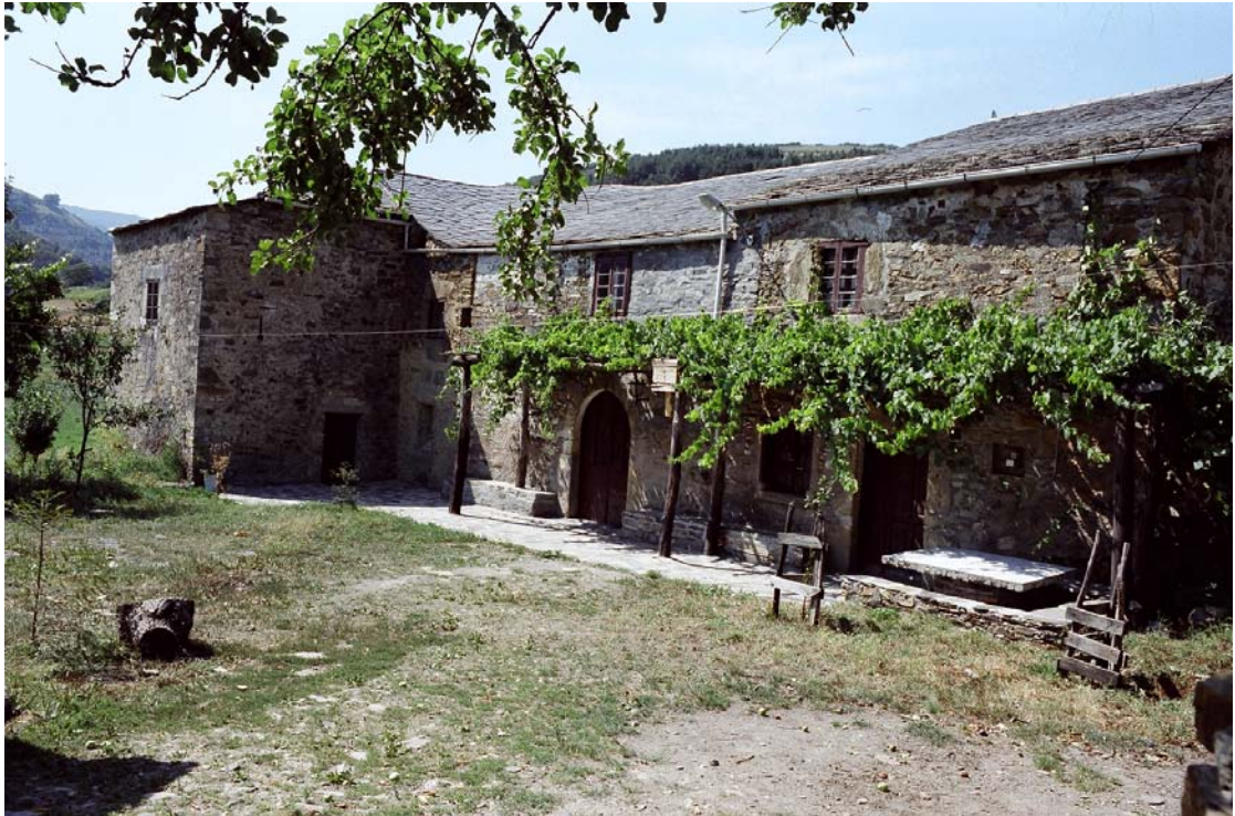
Lamas de Moreira, Fonsagrada (Lugo). Palacio

Servicio de Biblioteca Documentación y Archivo