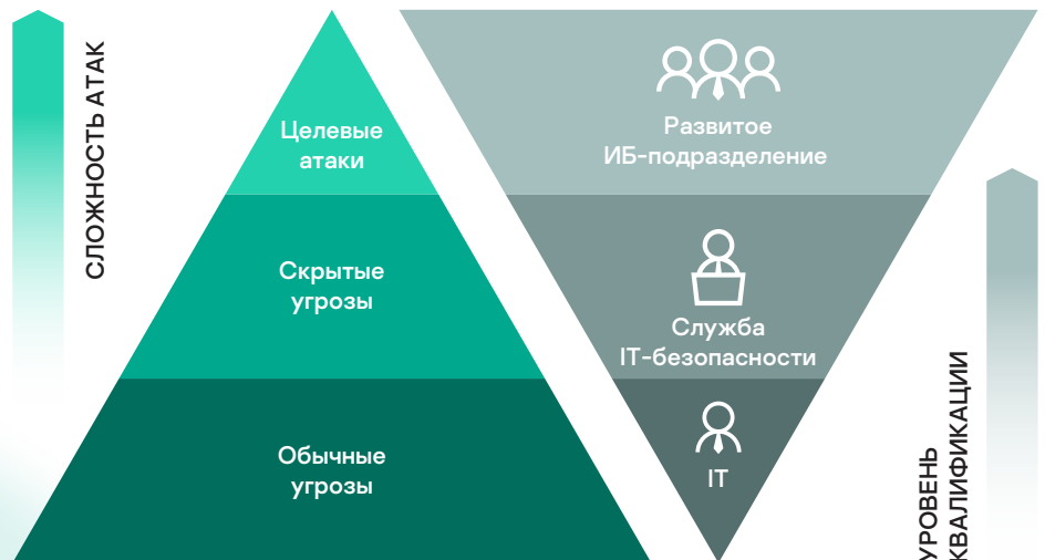
Рис 1. Типы угроз и квалификация сотрудников

И наконец, на самой вершине пирамиды находятся сложные АРТ-угрозы и атаки с использованием неизвестных ТТР. Организаторы атак в этой категории располагают практически неограниченными ресурсами для разработки очень сложных инструментов и методов, как правило, предназначенных для целенаправленных атак на конкретные цели.