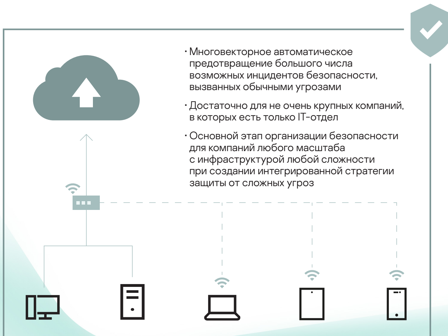
Рис 3. Основные характеристики уровня 1

Компании не могут пропустить этот этап и сразу перейти к использованию более продвинутых технологий обнаружения и реагирования. Дело в том, что большинство этих технологий подразумевает вовлечение специалистов, что, во-первых, сопряжено с немалыми затратами, а во-вторых, требует значительного опыта. В итоге высокооплачиваемые ИБ-специалисты просто утонут в море оповещений об инцидентах, а большинство угроз так и не будут предотвращены. Вместо проактивного поиска маскирующихся угроз и реагирования на инциденты безопасности ИБ-специалисты вынуждены будут заниматься сортировкой и приоритизацией оповещений, причем большинство из них так и не будет расследовано.