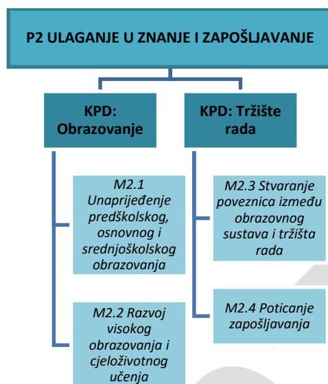
Slika 2: Ključna područja djelovanja i mjere u okviru Prioriteta 2