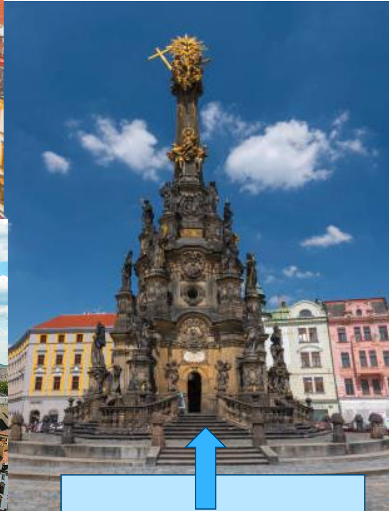
The Holy Trinity Column Town hall