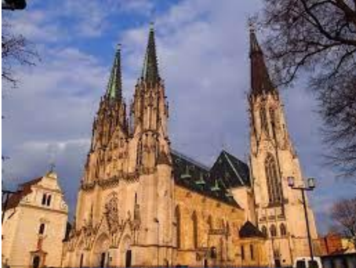
Saint Wenceslas Cathedral Katedrála sv. Václava