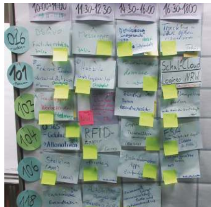
Volles Programm in allen Arbeitsräumen beim Aktivcongress 2019.

Für unsere eigene Arbeit betreiben wir unseren eigenen Mailserver . Überhaupt laufen die meisten Dienste, die wir selber nutzen, auf unseren eigenen Servern im