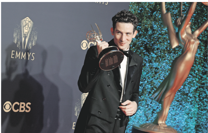
Лауреатом премии в категории «Лучший актёр в драматическом сериале» стал Джош О'Коннор (за фильм «Корона»)