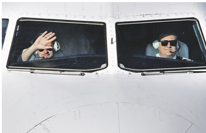
Виталий Алехин / РИА Новости