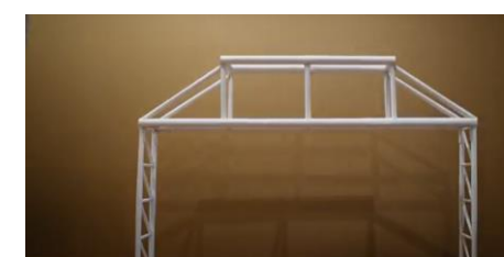
Figura 2. Estructura del 18 concurso.