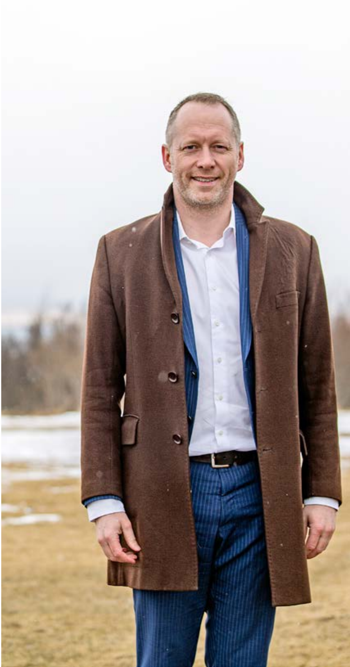
Mummi þekkti engan samkynhneigðan þegar hann var að alast upp.

Mummi er afar ánægður með auknar fjárveitingar til ráðuneytisins á kjörtímabilinu, en það hefur orðið um 50% aukning frá 2017 til 2021. „Þetta aukna fjármagn gefur