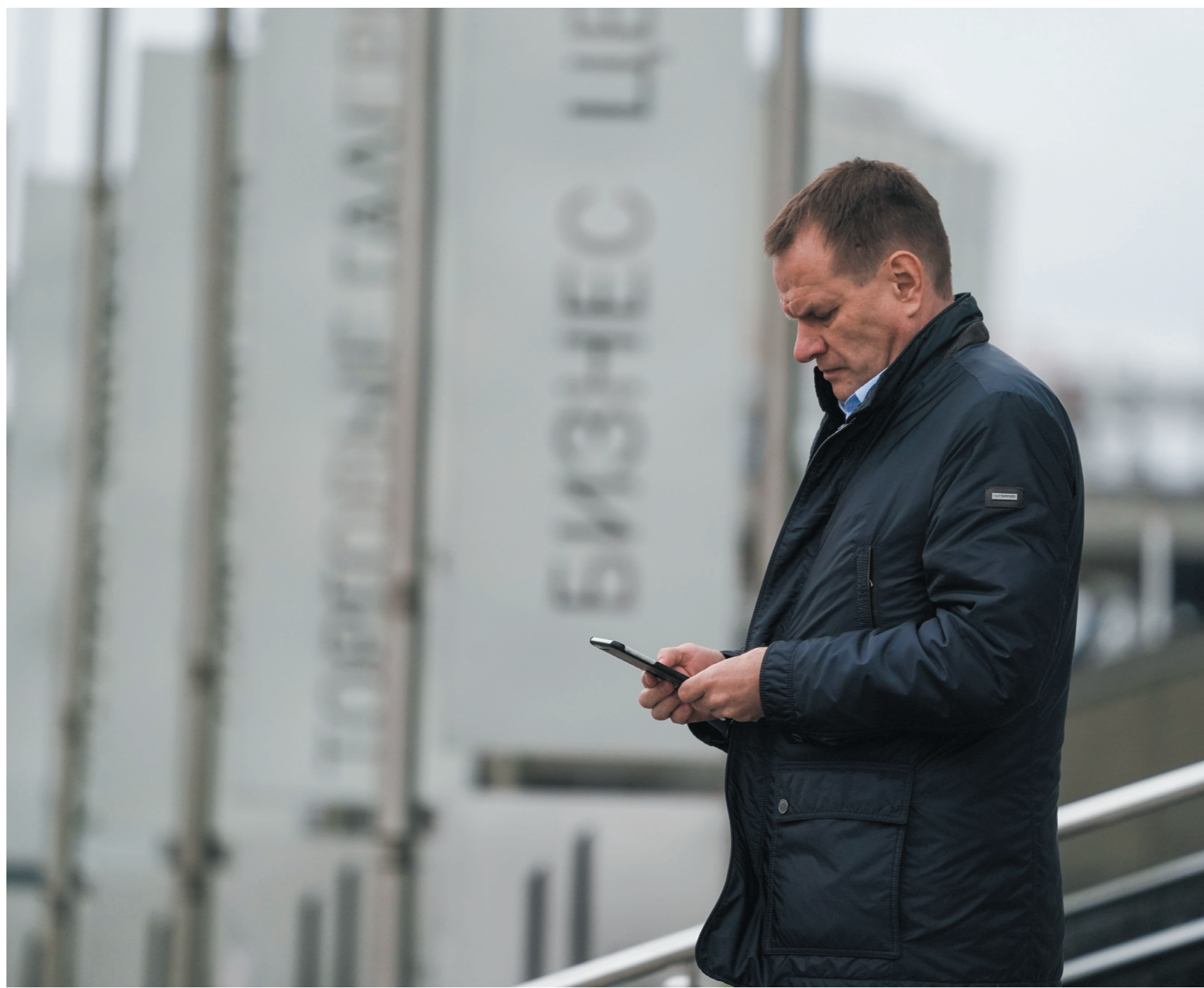
Дмитрий Коротаев / Иллюстрация

В Московской области лучший климат в России для ведения бизнеса