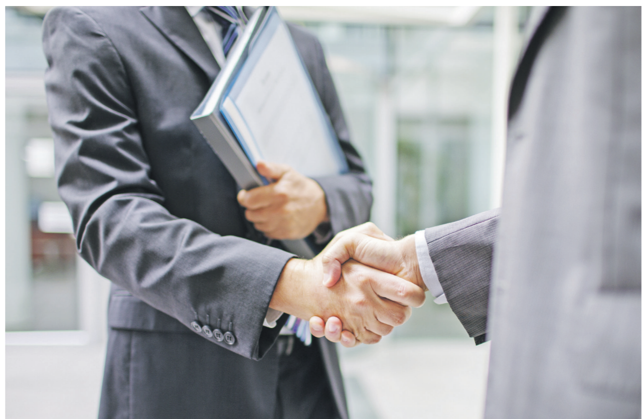
В России начал складываться институт деловой этики

Мнение автора может не совпадать с позицией редакции