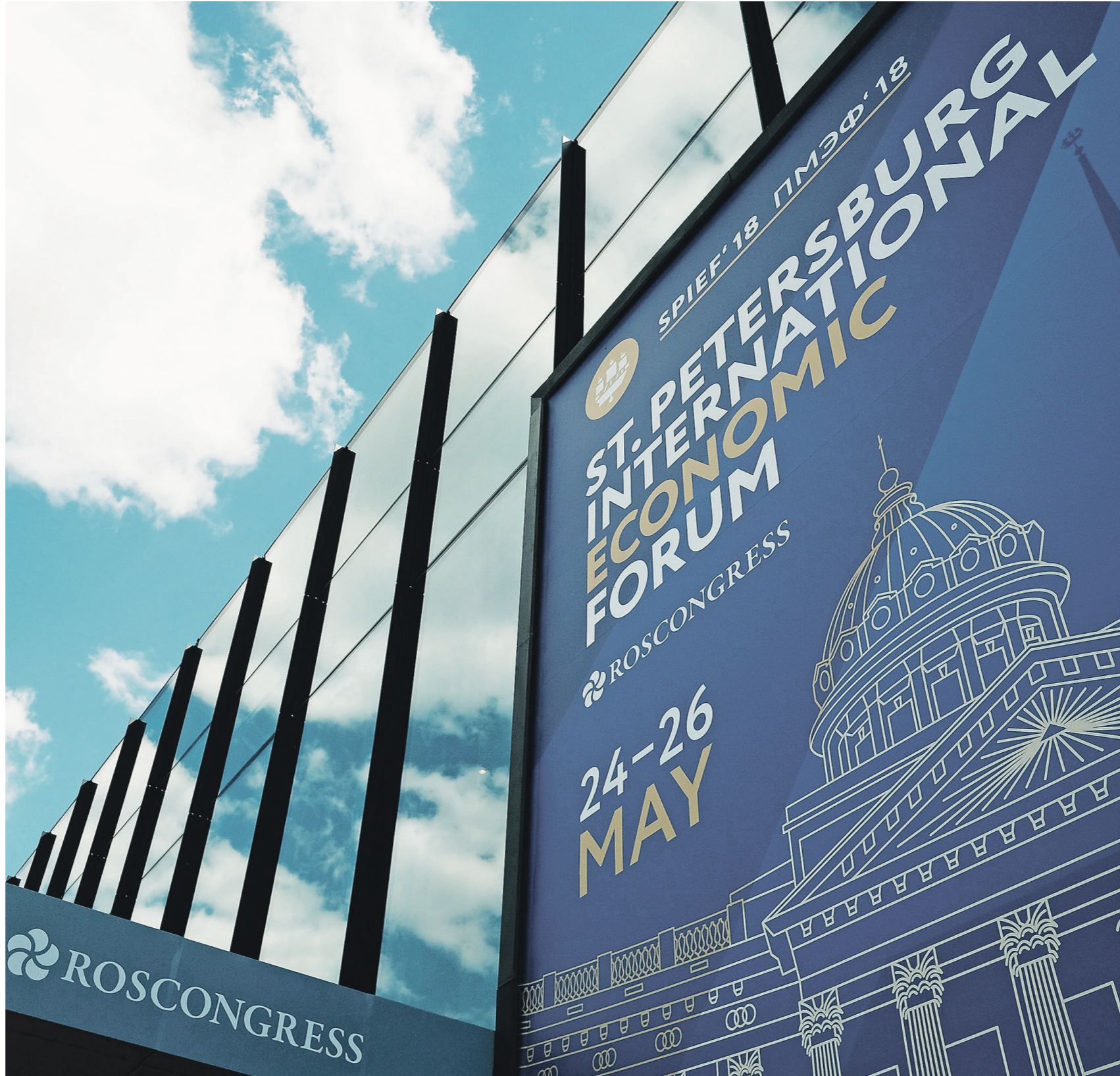
В этом году форум посетят 15 тысяч человек из 140 стран | РИА Новости | Алексей Даничев

В рамках форума пройдет два бизнес-диалога: Россия — Индия и Россия — Африка. Ожидается участие делегации из Израиля. Швейцарию на ПМЭФ-2018 представит министр финансов Ули Маурер. Традиционно площадку посетят главы крупнейших российских компаний и банков, а также представители власти.