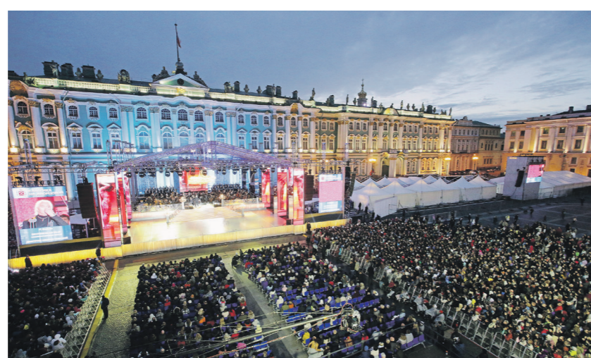
Гала-концерт «Классика на Дворцовой» станет кульминацией культурной программы ПМЭФ

Традиционно в дни работы форума ведущие музеи Санкт-Петербурга и пригородов будут доступны для участников ПМЭФ-2018 бесплатно — по бейджу «Премиум». Ну а посмотреть на карнавальное шествие Санкт-Петербургского международного фестиваля циркового искусства, парад духовых оркестров и оркестров барабанистов, Петербургский международный парад ретроавтомобилей и мотоциклистов, светомузыкальное шоу «Поющие мосты» и праздничный фейерверк смогут все желающие.