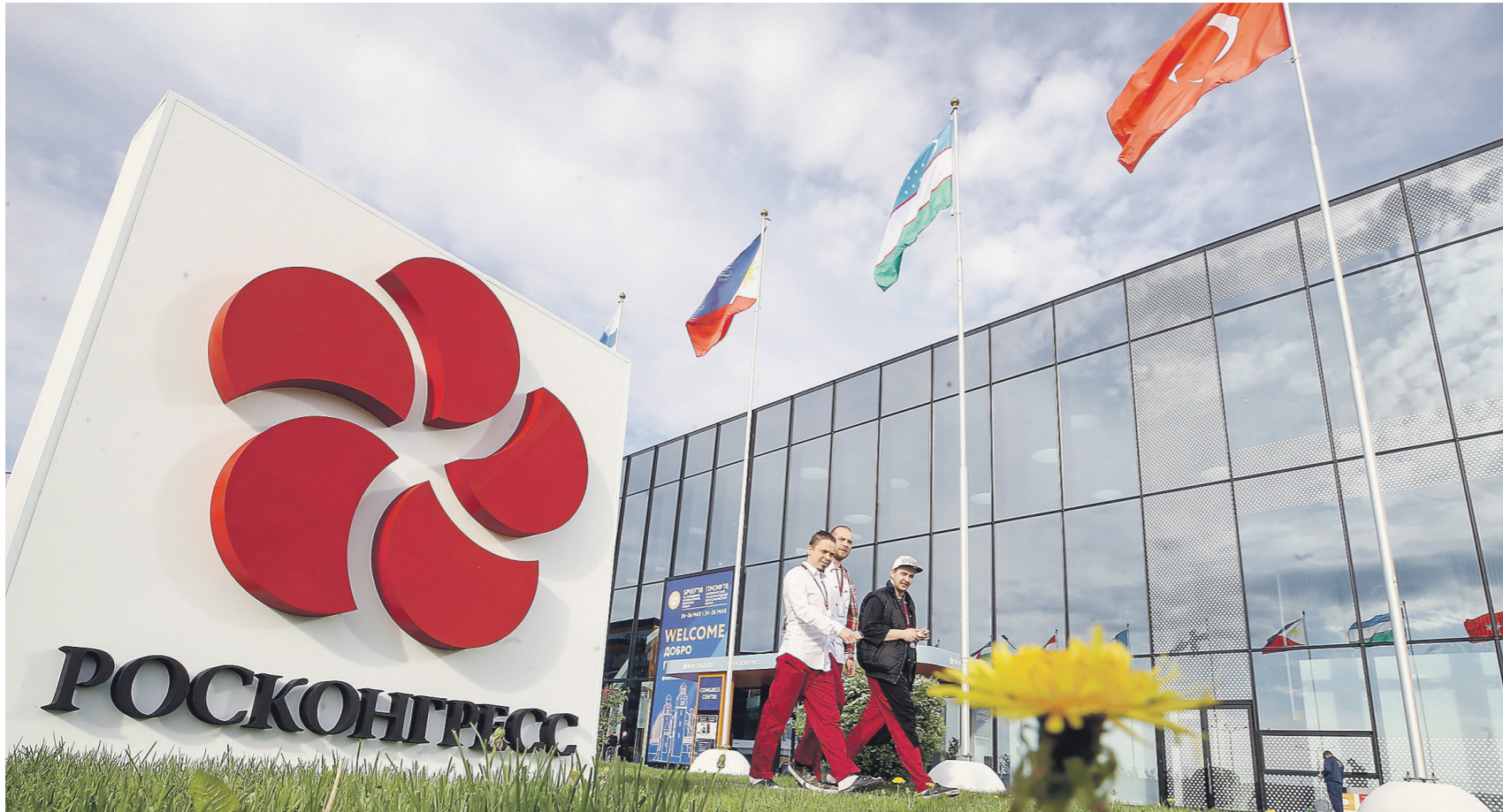
Проведение крупных экономических форумов повышает инвестиционную привлекательность России

Крупнейшие системообразующие организации России потратили рекордные суммы на участие в форуме