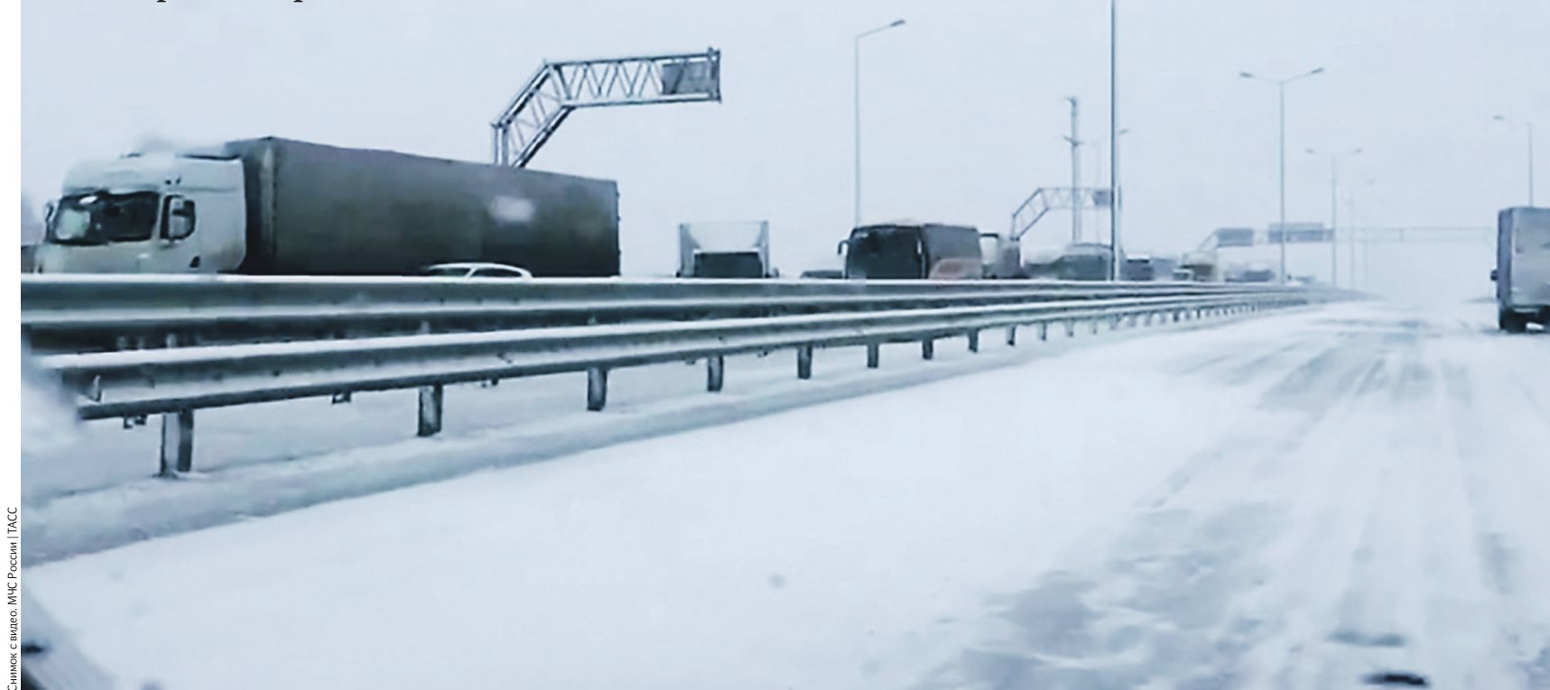
Снимок с видео. МЧС России/ТАСС

Как Крым справляется с аномальными снегопадами