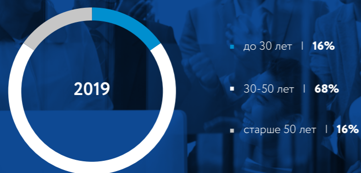
Таблица 2 Общее количество работников организации по состоянию на 01.01.2020