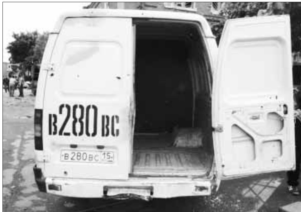
Белая «Газель», таинственно исчезнувшая из уголовного дела по Беслану