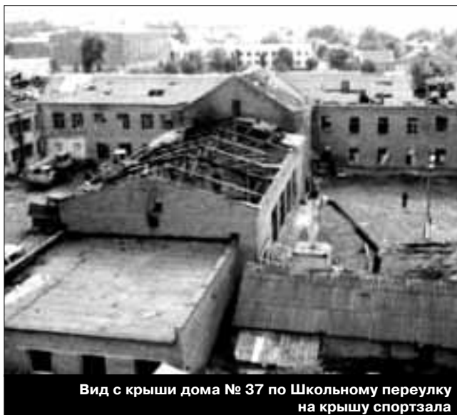
Вид с крыши дома № 37 по Школьному переулку на крышу спортзала

Прямым материальным свидетельством взрыва, произошедшего в северо-западной части спортивного зала, является пролом — разрушение северной стены спортзала под подоконником окна, примыкающего к западной стене.