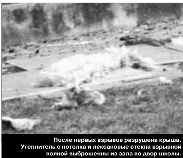
После первых взрывов разрушена крыша. Утеплитель с потолка и лексановые стекла взрывной волной выброшены из зала во двор школы.