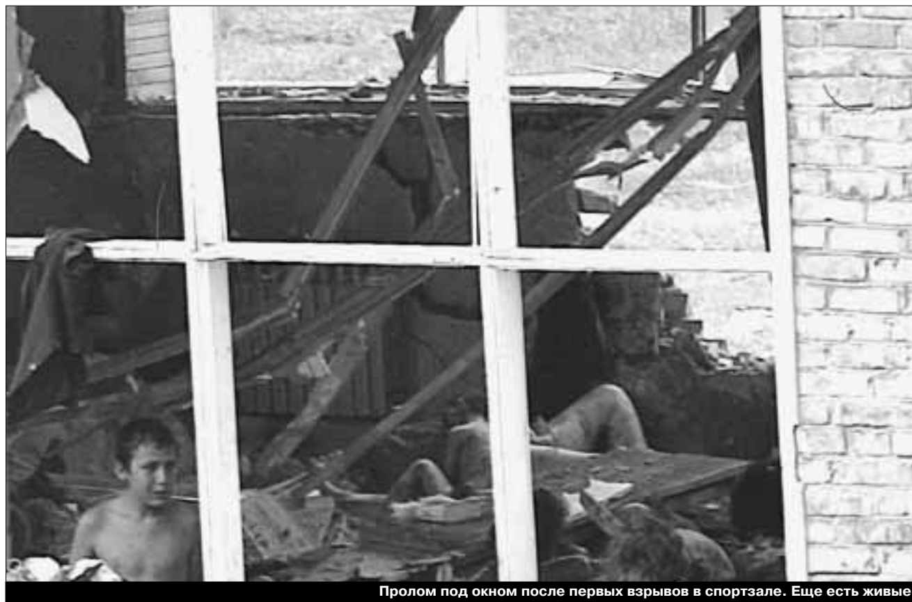
Пролет под окном после первых взрывов в спортзале. Еще есть живые

Перед силовиками встает трудно разрешимая задача, которую я бы сформулировала так: не