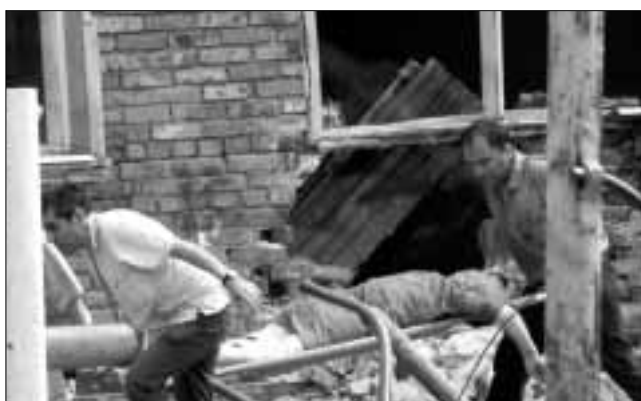
После второго взрыва осталась целой оконная рама