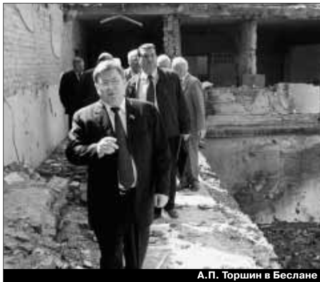
А.П. Торшин в Беслане

ке, Самаре, Воронеже, Махачкале и по результатам проведенного анализа выработаны совместные с МВД России мероприятия. Меры, направленные на совершенствование оперативно-служебной деятельности территориальных органов безопасности, органов безопасности в войсках, региональных пограничных управлений и органов внутренних дел по линии борьбы с терроризмом и политическим экстремизмом, были изложены в директивном указании ФСБ России — МВД России от 28 июля 2004 г.