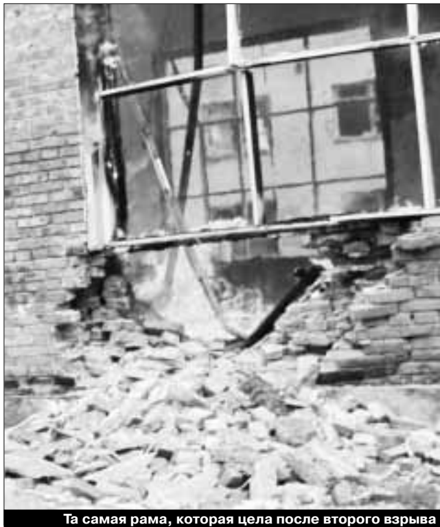
Та самая рама, которая цела после второго взрыва