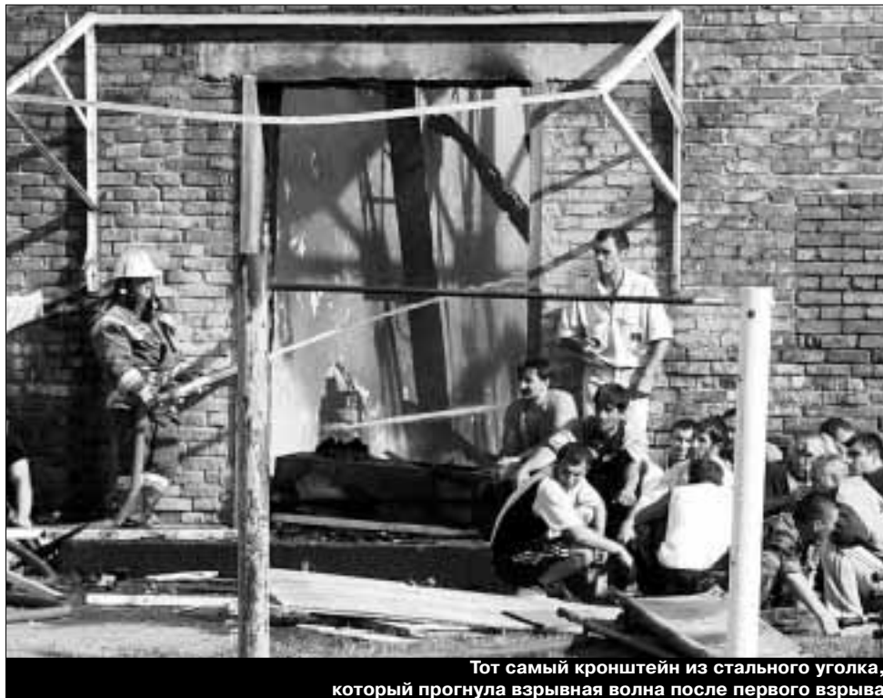
Тот самый кронштейн из стального уголка, который прогнула взрывная волна после первого взрыва