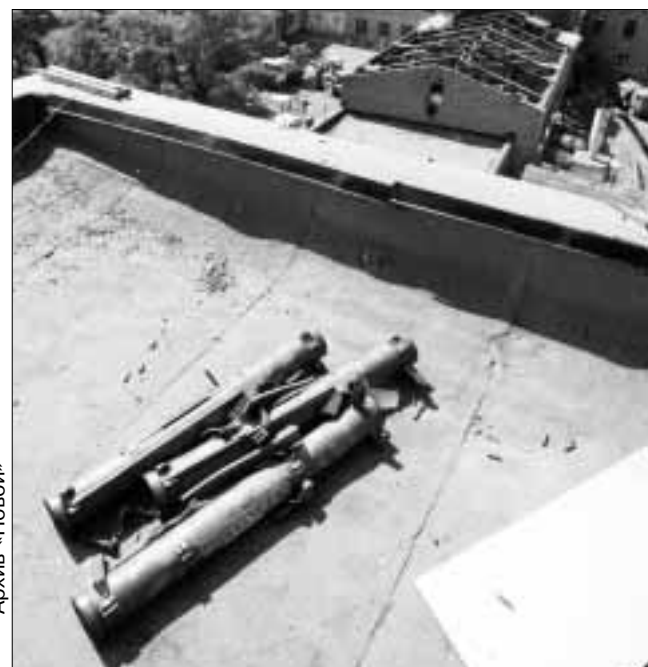
Огнеметы, найденные Парламентской комиссией на крыше 37 дома по Школьному переулку

Таким образом, ни одна из официальных версий не подтверждается наукой. Они ей попросту противоречат. Также взрывы в западной части спортзала не могут объяснить ни одно из существенных явлений, произошедших в восточной части зала на расстоянии 18—20 метров от эпицентра взрывов в западной части спортзала, описанных следствием: выбитые наружу двери основного входа спортзала, сорванный наружный железный настил козырька над этим входом, деформацию (прогиб) переднего кронштейна козырька, сделанного из стального уголка, наконец, дыру в крыше, деформацию и разруше-