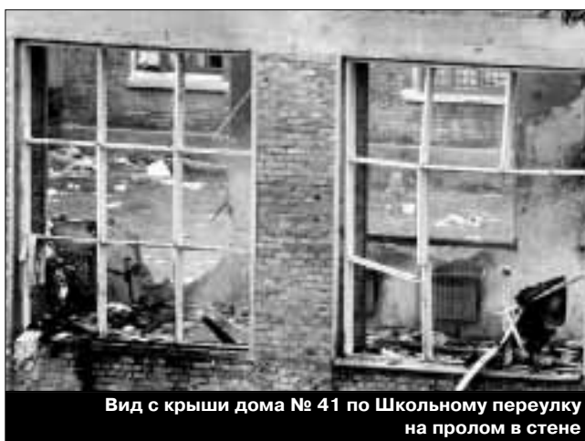
Вид с крыши дома № 41 по Школьному переулку на пролом в стене