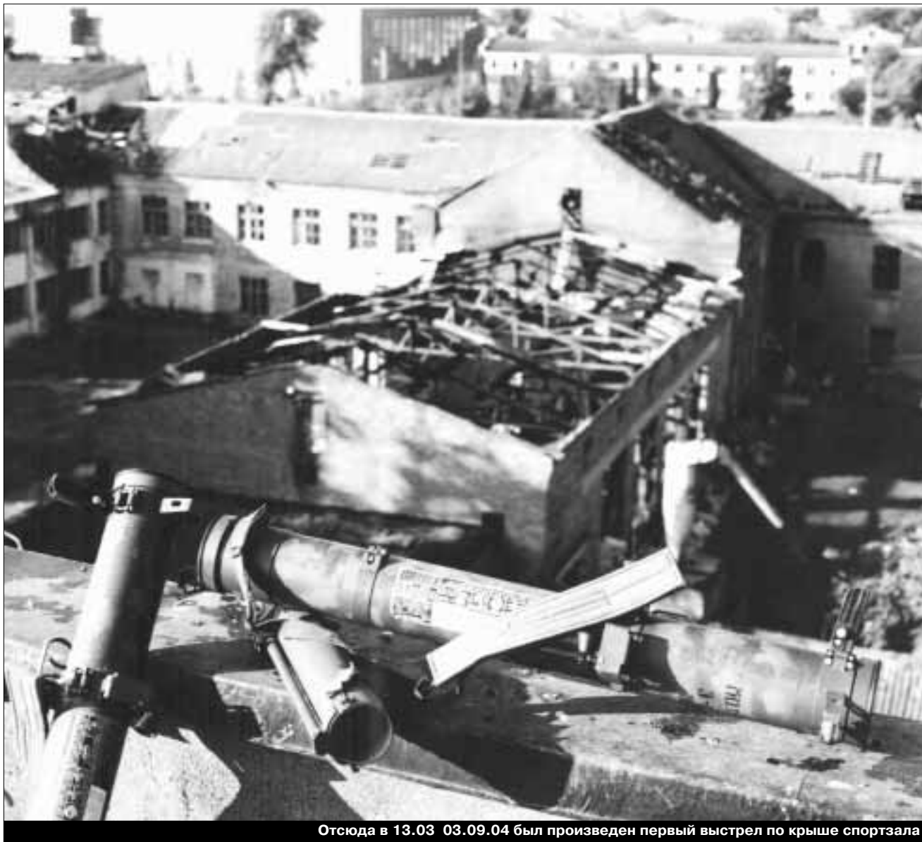
Отсюда в 13.03 03.09.04 был произведен первый выстрел по крыше спортзала