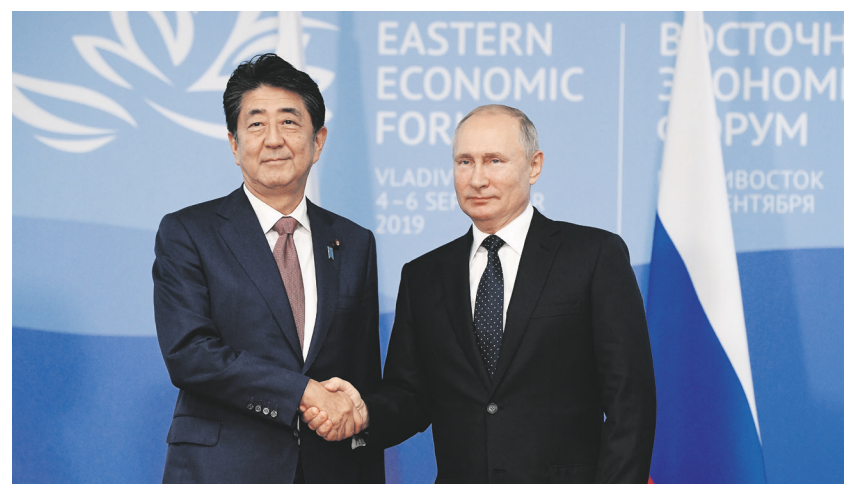
Премьер Синдзо Абэ и вице-премьер Юрий Трутнев

Арктика — цель, ради которой можно совершать технологический рывок, и золотая цепь, соединяющая страну.