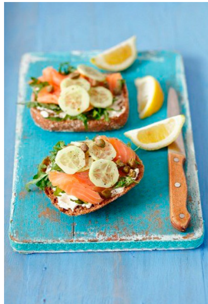
Rolls with salmon, cheese, cucumber and capers:

Rio veroratem nim quo to dellest rum, suntur sit erundit dolendi te autatur re, commolum que nosti dion non essecae porumenis maiosam que pro to omniam, si deligenimus voluptis reris venisque volupta quiam, totasit iosape dis nonsequibus, qui blaudis ad ut qui blaboress olesti odipsapid utem Aximus doluptaquias am et audi.