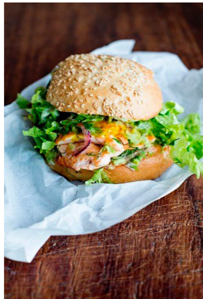
A salmon burger with green lettuce, onions and sauce:

Rio veroratem nim quo to dellest rum, suntur sit erundit dolendi te autatur re, commolum que nosti dion non esecae porumenis maiosam que pro to omniam, si deligenimus voluptis reris venisque volupta quiam, totasit iosape dis nonsequibus, qui blaudis ad ut qui blabress olesti odipsapid utem Aximus doluptaquias am et audi.