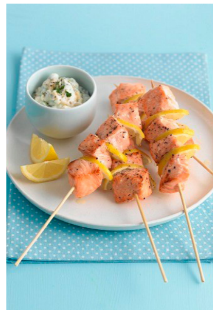
Salmon and lemon skewers:

Rio veroratem nim quo to dellest rum, suntur sit erundit dolendi te autatur re, commolum que nosti dion non esecae porumenis maiosam que pro to omniam, si deligenimus voluptis reris venisque volupta quiam, totasit iosape dis nonsequibus, qui blaudis ad ut qui blabress olesti odipsapid utem Aximus doluptaquias am et audi.