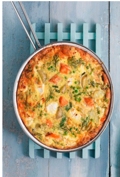
A salmon frittata in a pan:

Rio veroratem nim quo to dellest rum, suntur sit erundit dolendi te autatur re, commolum que nosti dion non essecae porumenis maiosam que pro to omniam, si deligenimus voluptis reris venisque volupta quiam, totasit iosape dis nonsequibus, qui blaudis ad ut qui blaboress olesti odipsapid utem Aximus doluptaquias am et audi.