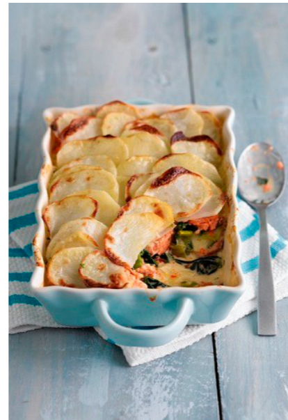
Salmon and potato pie with leek:

Rio veroratem nim quo to dellest rum, suntur sit erundit dolendi te autatur re, commolum que nosti dion non essecae porumenis maiosam que pro to omniam, si deligenimus voluptis reris venisque volupta quiam, totasit iosape dis nonsequibus, qui blaudis ad ut qui blaboress olesti odipsapid utem Aximus doluptaquias am et audi.