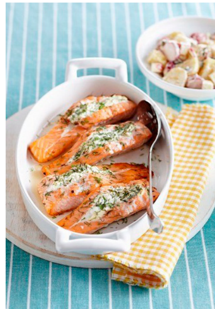
Oven-roasted salmon with dill cream:

Rio veroratem nim quo to dellest rum, suntur sit erundit dolendi te autatur re, commolum que nosti dion non esecae porumenis maiosam que pro to omniam, si deligenimus voluptis reris venisque volupta quiam, totasit iosape dis nonsequibus, qui blaudis ad ut qui blabress olesti odipsapid utem Aximus doluptaquias am et audi.