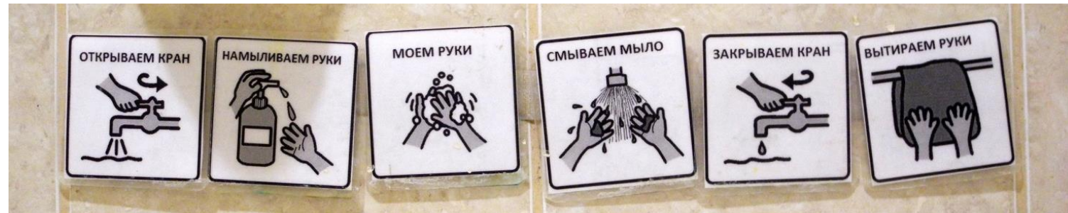
Последовательность действий при мытье рук

Сначала взрослый помогает ребенку сосредоточить внимание «здесь и сейчас», обозначая действие, которое в данный момент происходит. На следующих этапах взрослый учит удерживать в фокусе внимания уже цепочку действий, используя расписание из предметов-символов или картинок.