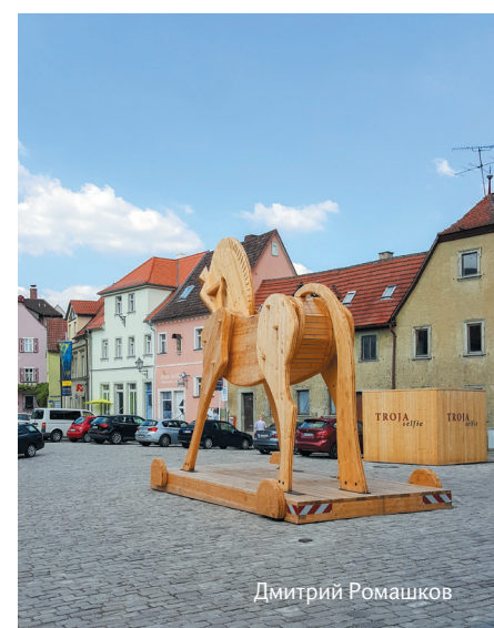
По случаю выставки «Троя» Рыночная площадь украсилась троянским конем