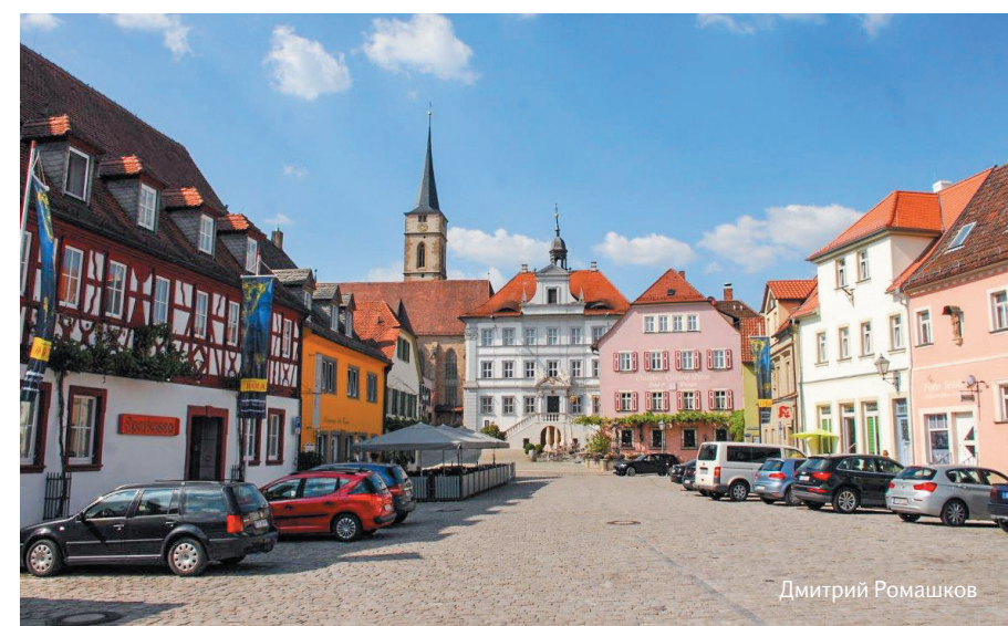
Жаркий полдень маленького Ипхофена

Вот и получается, что гипс, прекрасный строительный материал, ставший на многие века и продолжающий быть спутником технического