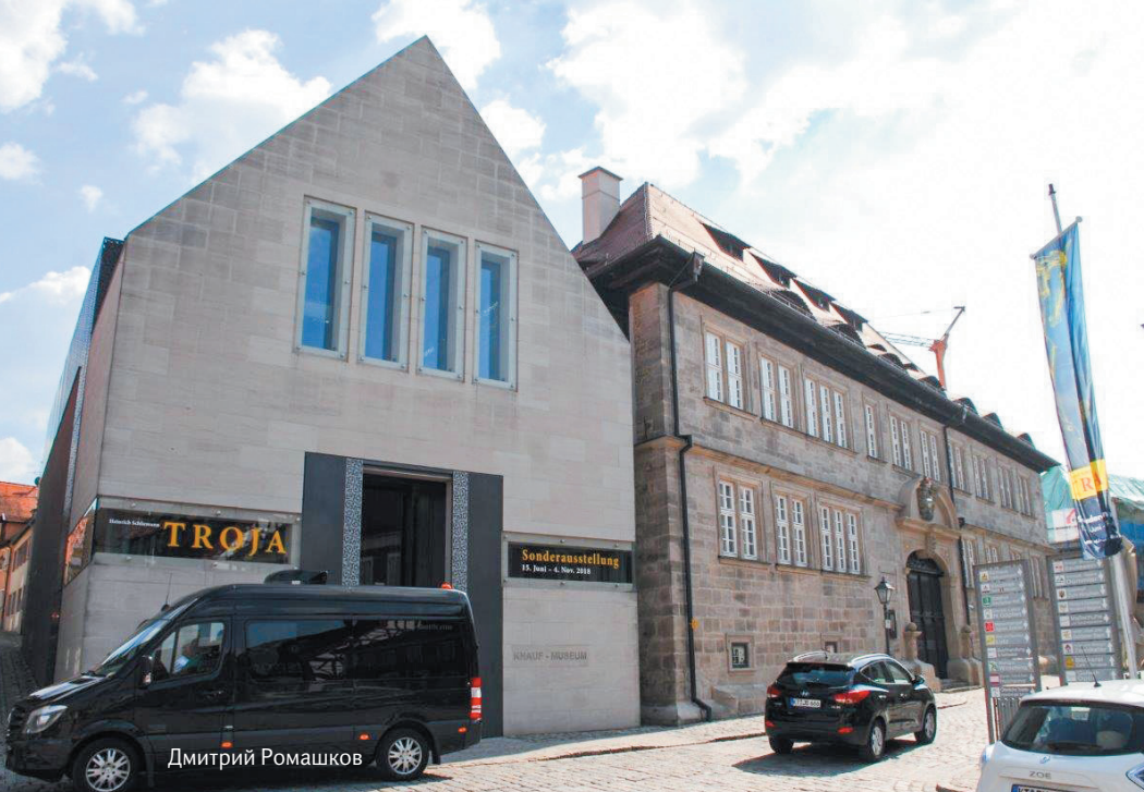
Музей гипсовых копий артефактов мирового искусства

Карл намеревались просто отдохнуть от повседневных дел и забот. Вышло по-другому. Они рассматривали в музеях рукотворные памятники, созданные древними египтянами, и размышляли: многим ли выпала возможность побывать кроме Египта в других музеях мира на разных континентах и воочию увидеть выставленные там экспонаты, свидетельства расцвета и упадка исчезнувших цивилизаций и культур: Месопотамии, Рима и Греции, Персии, Индии, Америки до ее колонизации?!