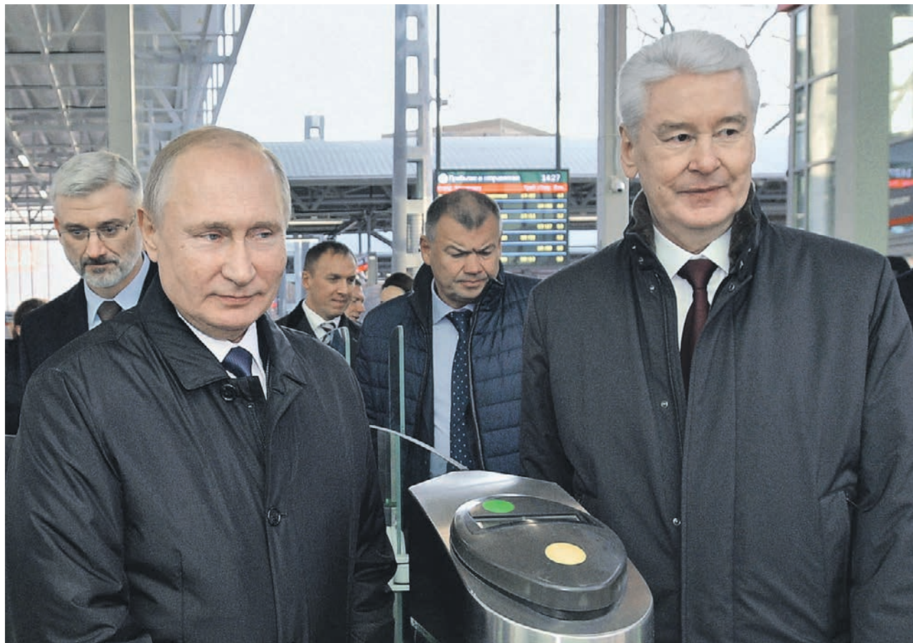
Президент России Владимир Путин и мэр Москвы Сергей Собянин (слева направо) запустили движение по Московскому центральному диаметру на Белорусском вокзале

По диаметрам следуют составы новейшего типа «Ивол-