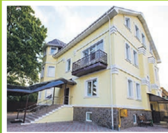
Дом в Малаховке