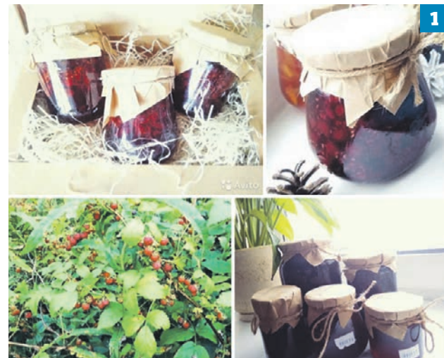
Фотографии товаров в одном из открытых объявлений о продаже домашнего варенья (1) и соленых грибов (2)