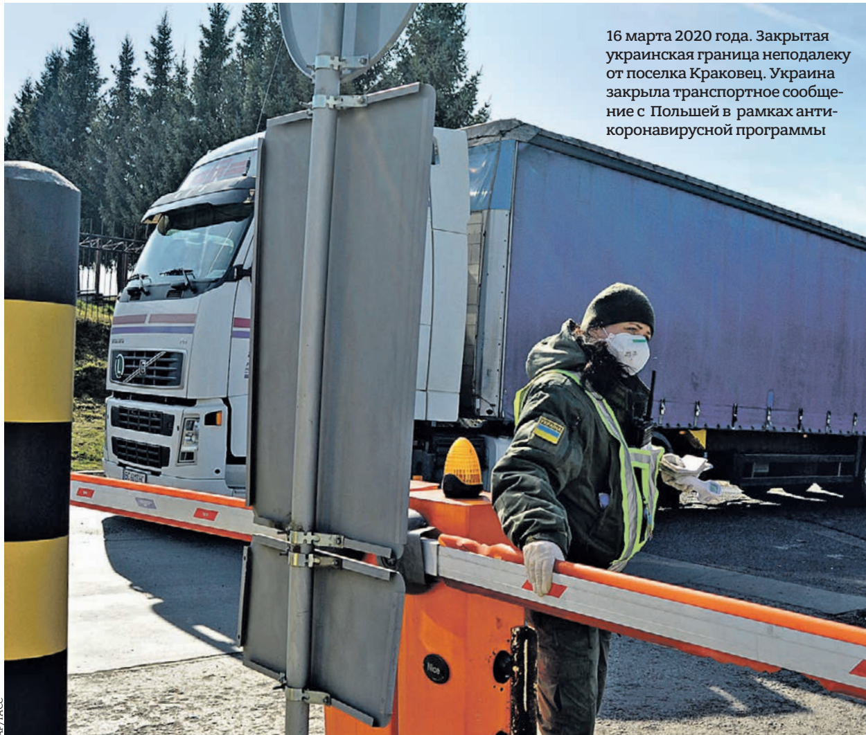
16 марта 2020 года. Закрытая украинская граница неподалеку от поселка Краковец. Украина закрыла транспортное сообщение с Польшей в рамках анти-коронавирусной программы