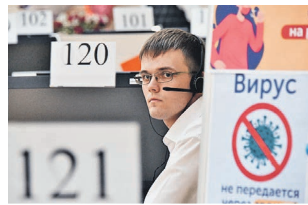
12 марта 2020 года. На 5 тысяч звонков ежедневно отвечают в кол-центре Департамента здравоохранения

Также в столичном Департаменте здравоохранения действует круглосуточная информационная линия по вопросам диагностики и профилактики коронавируса. Звоните: 8(499) 251-83-00.