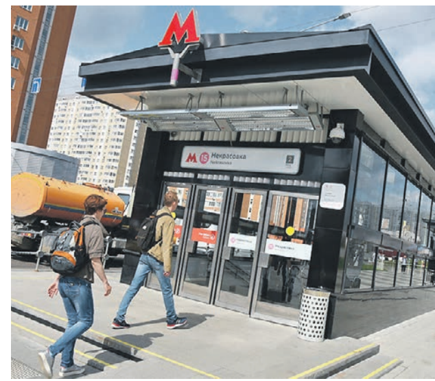
16 марта 2020 года. Пассажиры у станции «Некрасовская» Некрасовской линии метрополитена