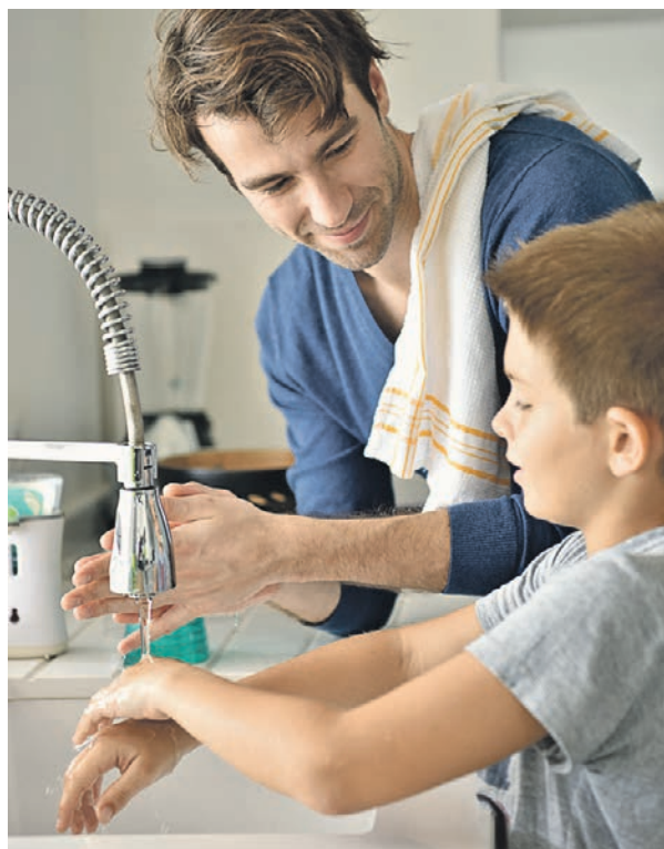
Руки нужно держать в чистоте и мыть их после улицы, перед едой, приходя на работу