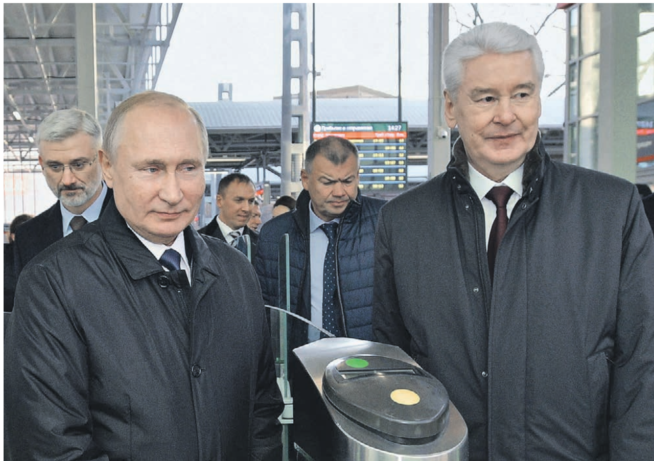
Президент России Владимир Путин и мэр Москвы Сергей Собянин (слева направо) запустили движение по Московскому центральному диаметру на Белорусском вокзале

По диаметрам следуют составы новейшего типа «Ивол-