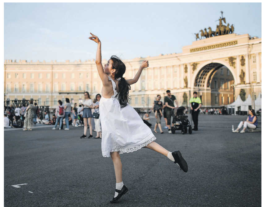
Культурная программа ПМЭФ в 2019 году отличалась многообразием