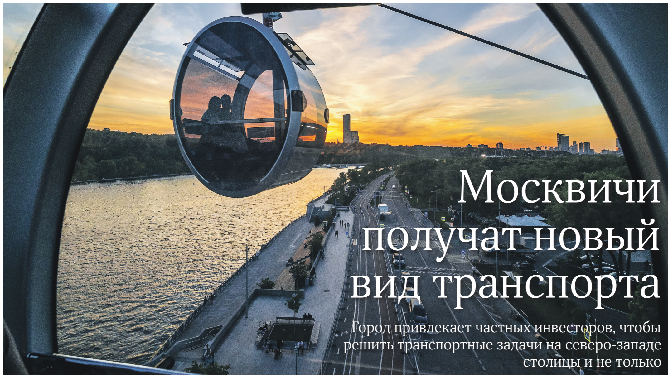
Константин Юсупов / Иллюстрация