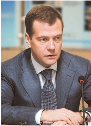
Дмитрий Медведев Председатель Правительства РФ