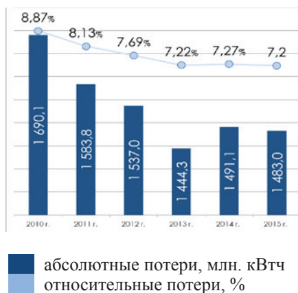
Рис. 5. Потери электрической энергии в сетях

В целом, в энергетике Республики Татарстан по итогам 2015 года снижен удельный расход топлива на выработку электрической энергии на 2,4% к уровню 2014 года (удельный расход составил 307,85 г/кВтч, рисунок 4). Доля потерь электрической энергии в сетях составила 7,2% при нормативе в 8,05% (в 2014 году фактические потери составили 7,27% к отпуску в сеть, рисунок 5).