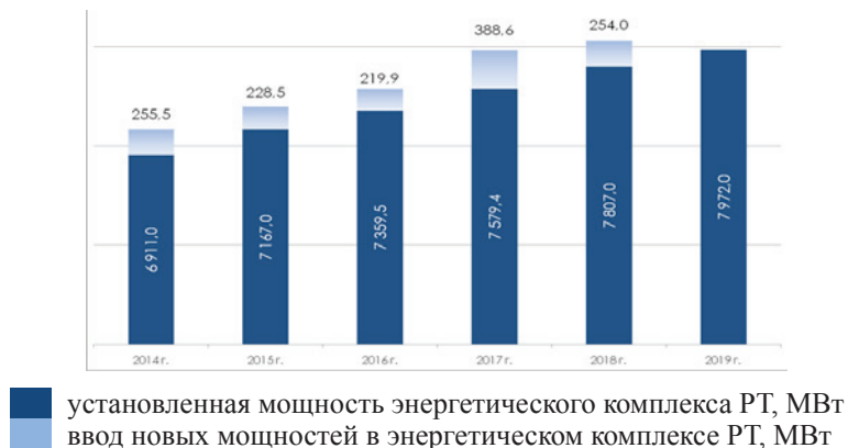
Рис. 6. Реализация дорожной карты Республики Татарстан по вводу энергетических мощностей на 2014–2019 годы

Назову несколько проектов по вводу новых мощностей. ОАО «Генерирующая компания» в 2014 году реализовала проект строительства парогазовой установки мощностью 220 МВт на Казанской ТЭЦ-2. В 2015 году ПАО «Татнефть» завершена реконструкция Нижнекамской ТЭЦ с увеличением мощности на 350 МВт.