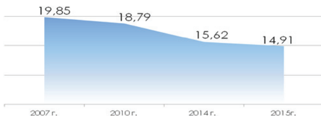
Рис. 3. Динамика индикатора энергоемкости промышленности Республики Татарстан

Значительный вклад в снижение энергоемкости экономики вносят промышленные предприятия Республики Татарстан, которые реализуют программы энергосбережения. Результативная работа по снижению энергоемкости производства проводится на ПАО «Казаньоргсинтез», ПАО «Татнефть», ПАО «Нижнекамскнефтехим», ОАО «Генерирующая компания», ОАО «ТГК-16» и других предприятиях. По итогам 2015 года индикатор энергоемкости в промышленности снижен на 4,5% к 2014 году (на 24,9% к 2007 г., рисунок 3)