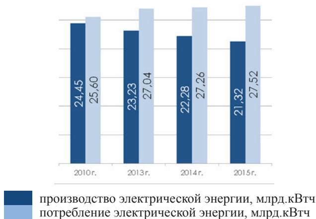
Рис. 1. Динамика производства и потребления электрической энергии в Республике Татарстан (по данным Росстата)

Следует отметить, что по итогам 2015 года энергоёмкость валового регионального продукта Республики Татарстан снизилась на 23,2% относительно базового 2007 года. Задача к 2020 году – обеспечить снижение энергоёмкости экономики Республики Татарстан еще на 16,8% (Рисунок 2).