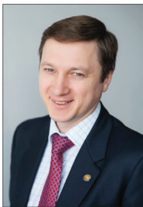
Заместитель Премьер-министра РТ – министр промышленности и торговли РТ