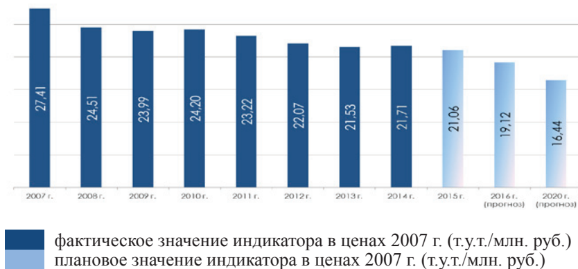
Рис. 2. Динамика энергоёмкости валового регионального продукта Республики Татарстан

Следует отметить, что по итогам 2015 года энергоёмкость валового регионального продукта Республики Татарстан снизилась на 23,2% относительно базового 2007 года. Задача к 2020 году – обеспечить снижение энергоёмкости экономики Республики Татарстан еще на 16,8% (Рисунок 2).