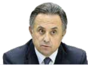
Виталий МУТКО, министр спорта РФ

«Сборная России, к сожалению, конечно, не справилась с поставленной задачей. Где-то чуть-чуть везения не хватило».