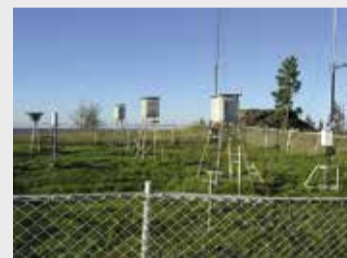
Метеостанция «Валаам» оснащена современным метеорологическим комплексом, но дизельный генератор не может обеспечить стабильного электроснабжения

Работы являются частью программы по модернизации и техническому перевооружению учреждений и организаций Росгидромета на территории Республики Карелия. Устойчивое электроснабжение метеостанции – первоочередной вопрос для точного прогнозирования. На сегодня уже построена новая трансформаторная подстанция, расчищены просеки линии электропередачи, устанавливаются опоры ВЛ.