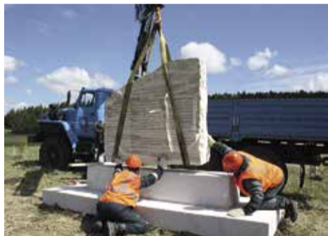
Момент установки памятника