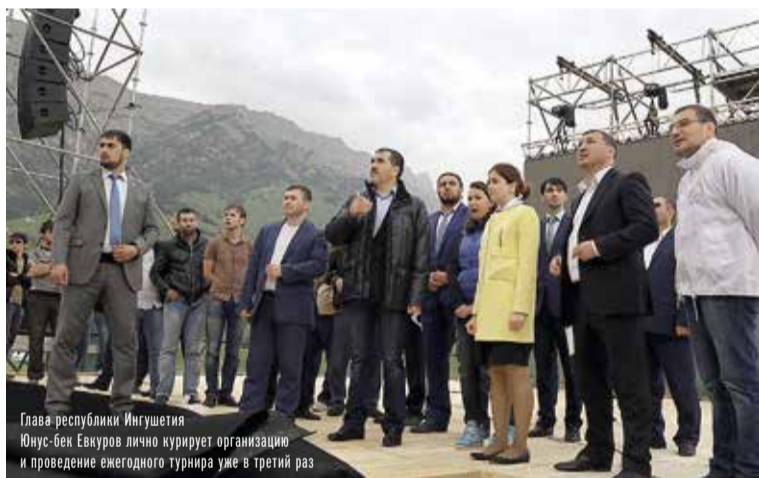
Глава республики Ингушетия Юнус-бек Евкуров лично курирует организацию и проведение ежегодного турнира уже в третий раз

К спортивному празднику энергетики полностью решили ряд задач, поставленных перед ними Главой Республики Ингушетия Юнус-беком Евкуровым. В предельно короткие сроки в пересеченной горной местности построены трансформаторные подстанции и воздушные линии электропередачи общей протяженностью около 3 км.