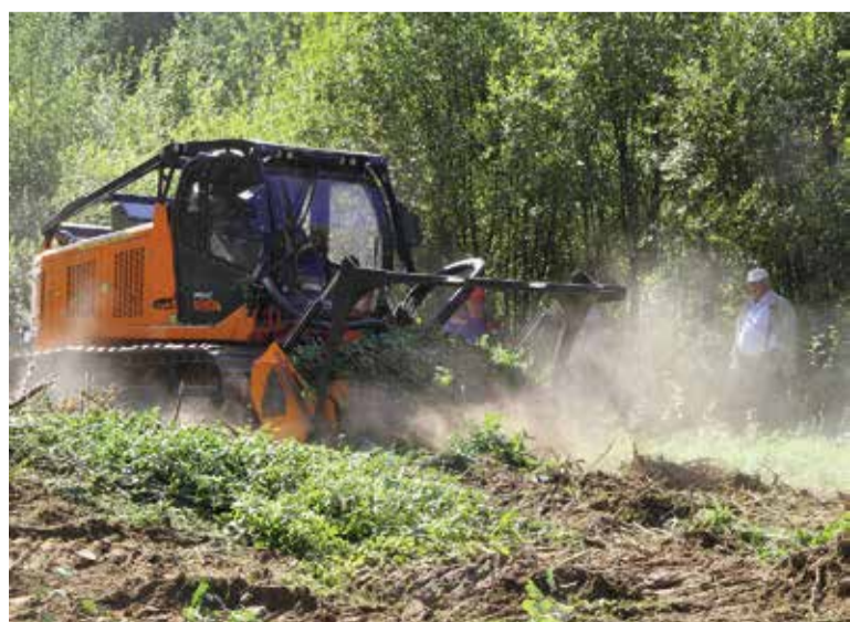
Идет расчистка. На линии работает мульчер

Предварительные проверки готовности электросетевых объектов предприятий группы «Россети» начнутся уже в середине июля и продлятся до конца лета. В течение сентября ДЗО будут иметь время устранить выявленные в ходе проверок недостатки. Наконец до 15 ноября закончатся проверки Минэнерго, по итогам которых каждый субъект электроэнергетики должен получить паспорт готовности к прохождению ОЗП.