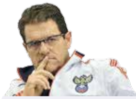
Фабио КАПЕЛЛО, главный тренер сборной России по футболу

Конечно, каждый имеет право на свою точку зрения, но вряд ли стоит ее при этом считать единственно верной. Может быть, действительно нашим игрокам просто не хватило везения, а может быть, не хватило поддержки болельщиков, нашей уверенности в победе сборной.