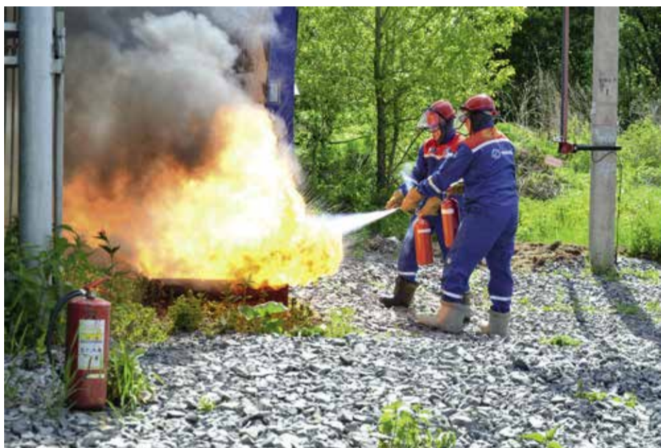
Подготовка персонала к ОЗП предполагает проведение противопожарных тренировок. Ликвидация пожара