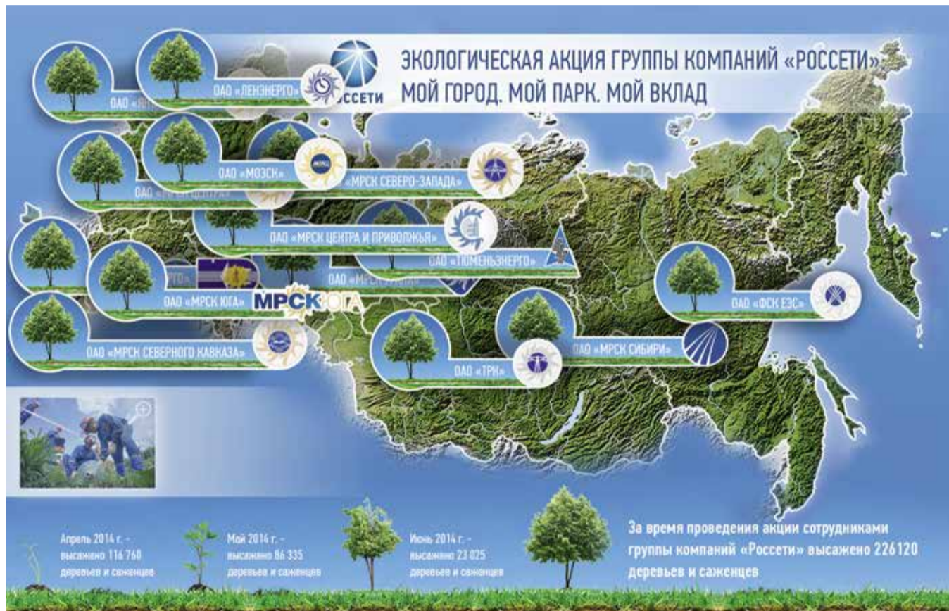
Весной 2014 года энергетики инициировали и провели всероссийскую экологическую акцию «Мой город. Мой парк. Мой вклад»

«Россети» – социально ответственная компания, стратегические цели и задачи которой тесно связаны с приоритетами общественного развития, в том числе в сфере экологической безопасности.