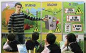
Разъяснять детям правила безопасного обращения с электричеством – обязанность не только энергетиков, но также педагогов и родителей

«Россети» реализуют программу мероприятий по предотвращению случаев травматизма сторонних лиц на объектах электросетевого хозяйства.