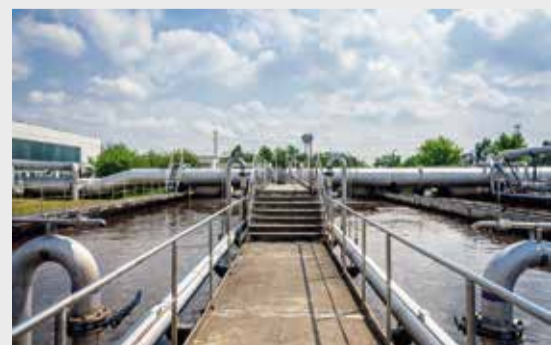
Очистные сооружения являются важнейшим объектом жизнеобеспечения почти 10 тыс. жителей Челябинской области

области. Смонтированы ячейки комплектного распределительного устройства наружной установки. После испытаний и комплексного опробования электрооборудование включено под нагрузку. Очистные сооружения являются важнейшим объектом жизнеобеспечения почти 10 тысяч местных жителей.