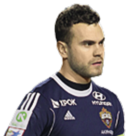
Игорь АКИНФЕЕВ, вратарь сборной России

«Сборная России, к сожалению, конечно, не справилась с поставленной задачей. Где-то чуть-чуть везения не хватило».