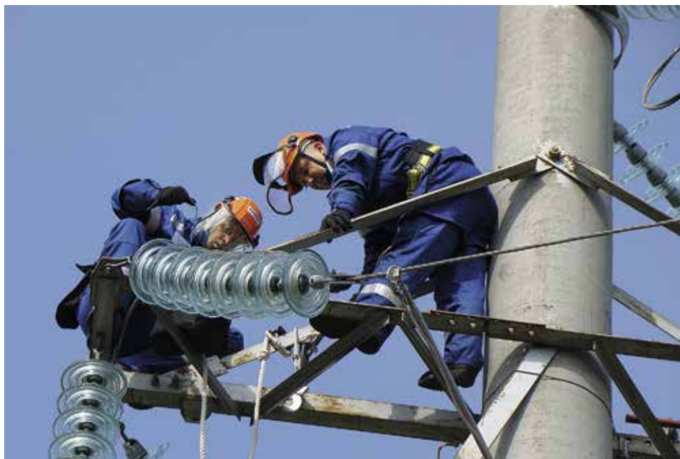
Проведение ремонтных работ – одно из условий подготовки к ОЗП