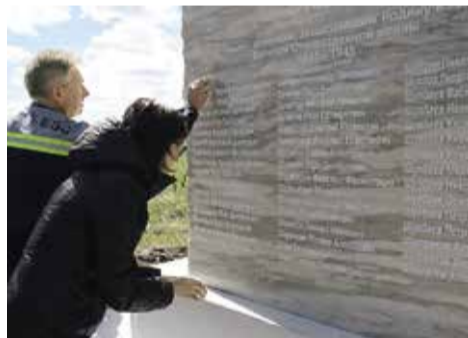
Пятьдесят мужчин деревни Тлечек героически сражались на фронтах Великой Отечественной войны