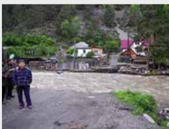
Тысячи жителей Хакасии, Тывы, Алтая и Алтайского края пострадали от аномального наводнения