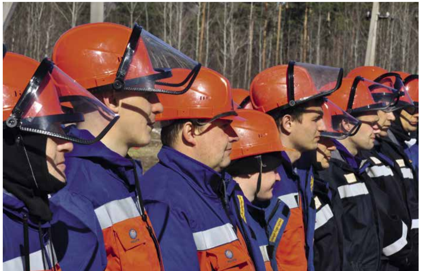
Условия успешного прохождения ОЗП – это готовность электросетевого оборудования, готовность персонала и готовность всех средств для проведения аварийно-восстановительных работ

Благодаря работе штабов по энергобезопасности, взаимодействию с ГУ МЧС и органами местного самоуправления энергетики предотвратили массовые отключения, оперативно восстановили работу сотен энергообъектов. Стихия показала, что предприятия «Россетей» готовы обеспечить надежное электроснабжение. В ряде случаев наши коллеги несли круглосуточную вахту, тогда как их собственное имущество гибло. В МРСК Сибири организован сбор средств для пострадавших. Работу энергетиков высоко оценили Глава Республики Хакасия Виктор Зимин и Полномочный представитель Президента РФ по Сибирскому федеральному округу Николай Рогожкин.