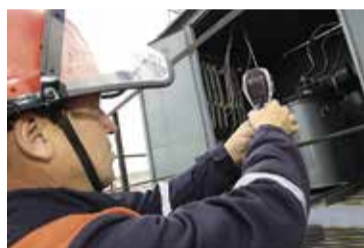
Паспорт готовности к прохождению ОЗП выдается на основании акта проверки готовности и выполнения всех основных и дополнительных условий готовности