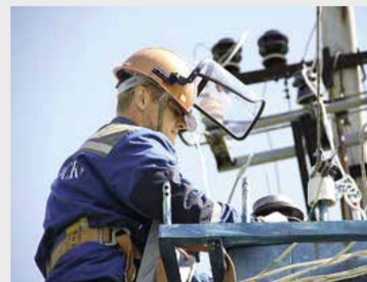
Единый комплекс учебно-тренировочных мероприятий помогает поддерживать высокий уровень готовности и квалификации персонала

Финальные отборочные соревнования ДЗО проведут в июле. Их победители выступят на Всероссийских соревнованиях профессионального мастерства в Пензе с 4 по 8 августа на полигоне филиала ОАО «МРСК Волги» – «Пензаэнерго». Победители всероссийского этапа будут представлять нашу страну на Международных соревнованиях бригад национальных энергосистем государств – участников СНГ, которые пройдут в сентябре 2014 года в Санкт-Петербурге на базе учебного полигона «Ленэнерго».