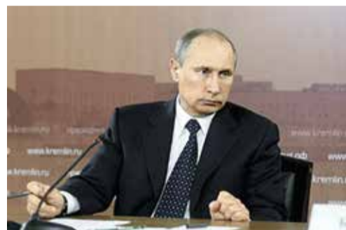
В июне Президент России дал поручение Правительству России, Правительству Архангельской области и НП «Совет рынка» проработать вопрос о смене гарантирующего поставщика в Архангельской области до 1 августа 2014 года

Генеральный директор ОАО «Россети» Олег Бударгин принял участие в совещании, посвященном социально-экономическому развитию Архангельской области, под председательством Президента РФ Владимира Путина.