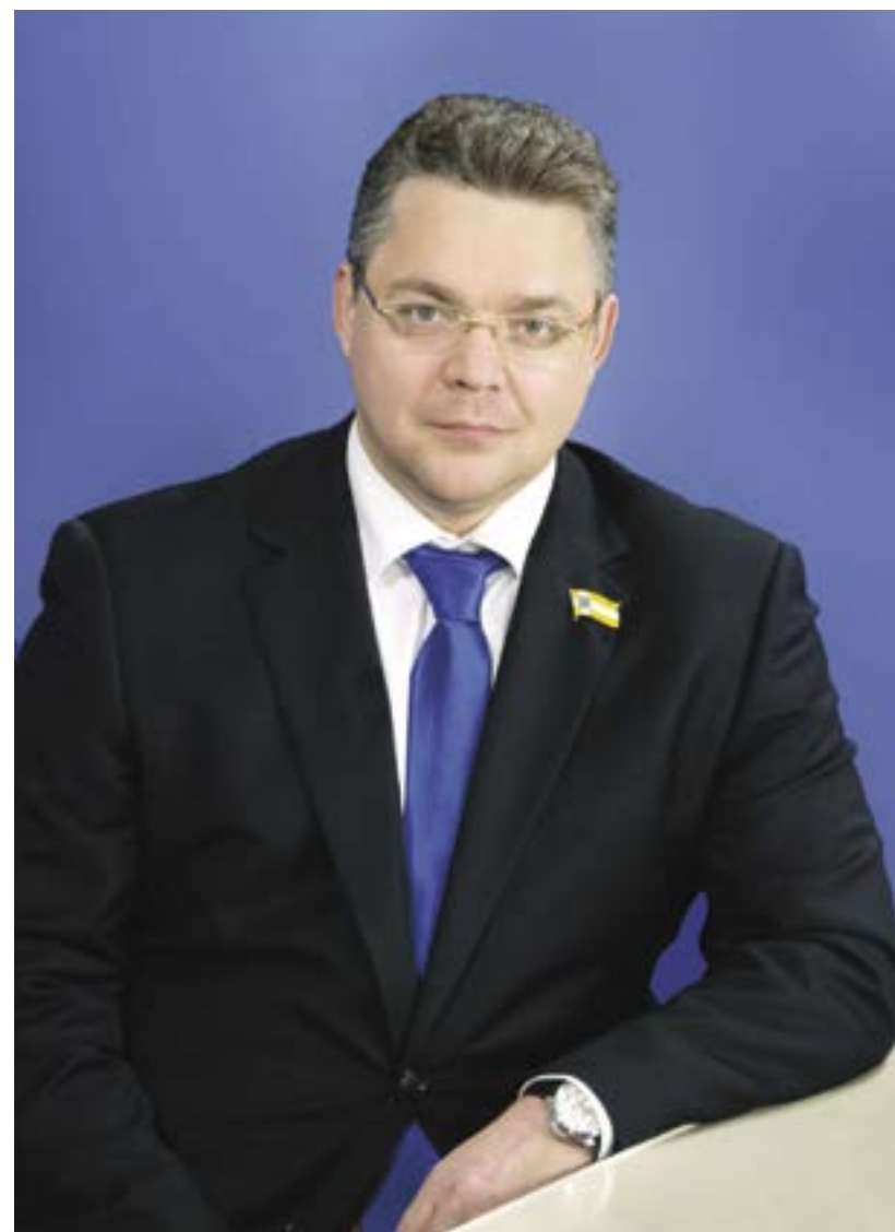
Губернатор Ставропольского края

От всей души желаю всем предпринимателям Ставрополья успехов, новых интересных проектов и реализации намеченных планов.