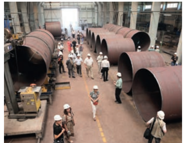
В одном из цехов предприятия