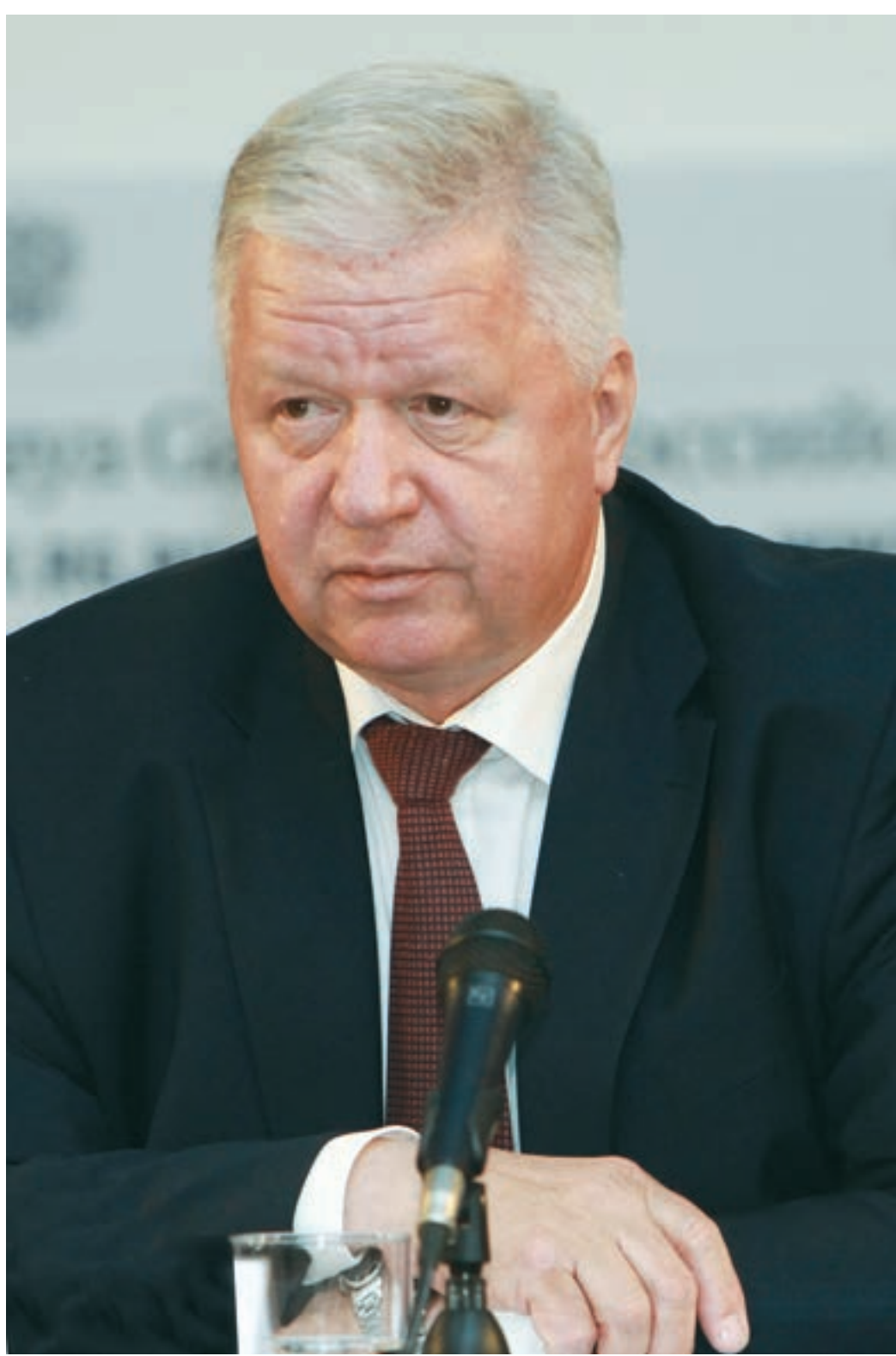
Председатель ФНПР М.В. Шмаков

– Действительно, в соответствии с решением Конституционного суда Министерством труда и социальной защиты РФ был подготовлен проект федерального закона по устранению не соответствующих Конституции ряда положений закона «О профсоюзах, их правах и гарантиях деятельности». Эти положения, в частности, устанавливали закрытый, исчерпывающий перечень видов профсоюзных организаций и их структурных подразделений. Тем самым профсоюзы лишались возможности самостоятельно, исходя из стоящих перед