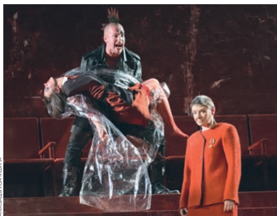
Сцена из спектакля «Васса»

При этом режиссер не дает актерам возможности вжиться в бытовую среду, да ее и нет, что в принципе было важно для Горького, создавая витрину отвратительных типов, стоящих на ступеньках огромной лестницы, ведущей к богатству и безнаказанности. Одним словом, Тыщук внедряет криминал в семейные отношения, предлагая зрителю испытать удовольствие от лицемерия змеиного клубка. Но вот