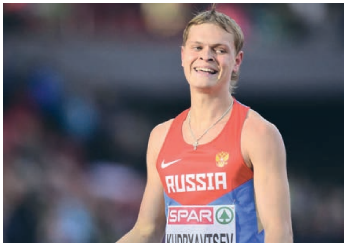
Денис Кудрявцев, установивший новый рекорд России в беге на 400 метров с барьерами, принес нашей сборной первую медаль на чемпионате мира по легкой атлетике в Пекине

Сделанный исторический экскурс вызывает вполне понятную ностальгию. Потому что все