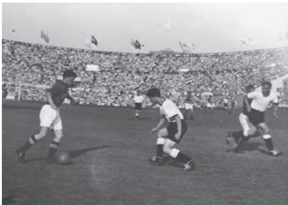
Посмотреть на товарищеский матч сборных СССР и ФРГ 21 августа 1955 года на стадион «Динамо» пришли более 54 тысяч человек

21 августа исполнилось 60 лет одному из самых памятных матчей в истории отечественного футбола, который кто-то метко назвал «матчем навсегда». В этот день в 1955 году на московском стадионе «Динамо» сборная СССР впервые встречалась с командой, которая носила в тот момент (как, впрочем, носит и сейчас) титул чемпиона мира – сборной ФРГ.