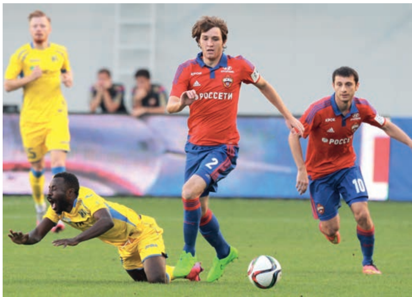
В текущем сезоне ЦСКА Леонида Слуцкого пока идет без поражений

Футбольный сезон в России набирает обороты и проходит на фоне известных перемен в нашем футболе. Позади шесть туров чемпионата страны в премьер-лиге. Таблицу возглавил клуб нового наставника сборной России Леонида Слуцкого ЦСКА, что, согласитесь, вселяет некоторый оптимизм в истомившихся по победам сердца болельщиков.