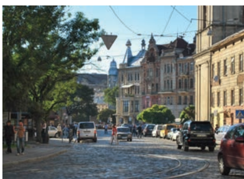
У многих домов старого Львова скоро будут новые хозяева

Прекрасно зная об ущербной украинской позиции, глава польской партии «Смена» Матеуш Пискорский не преминул предупредить, что ссылки на давние стандарты защиты недвижимости и имущества от прав на них прежних владельцев и наследников беспочвенны. «Сначала мы попробуем решать неизбежные проблемы цивилизованно», – сказал он. – Если же начнут возникать непреодолимые противоречия, то станем направлять иски в суды различных инстанций, которые примут решения в нашу пользу,