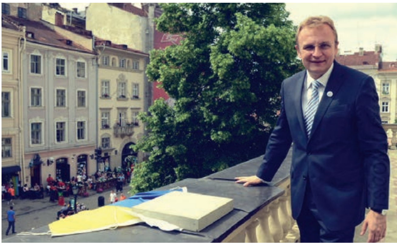
Мэр Львова Андрей Садовый

Хотя проводимые в наше время социологические опросы, как правило, являются заказными, в той или иной степени они все-таки отражают настроения в обществе. Свежий пример: если самые лояльные к правящему в Украине режиму социологи не рискуют выставлять кредит народного доверия выше 26,3 процента, то «счетоводы» из числа оппозиционных и хотя бы отчасти независимых экспертов определяют поддержку власти населением лишь в 8,4 процента.